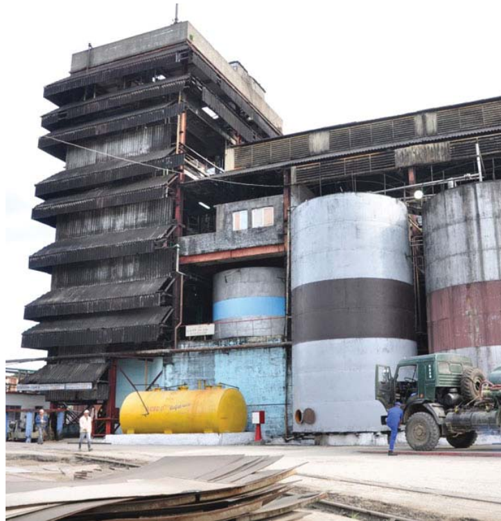
La calidad de los alcoholes de la industria espiritvana es reconocida nacionalmente.

Añadió la fuente que la UEB Derivados debe obtener este año 160 650 hectolitros de alcohol, cifra que de lograrse equivaldría a la segunda mayor producción de la planta, para lo cual debe recibir el 49 por ciento de la materia prima desde las provincias de Villa Clara, Ciego de Ávila y Camagüey;