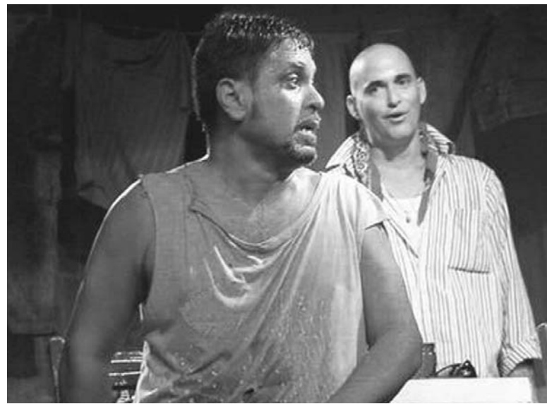
"No existen personajes pequeños", asegura el actor.