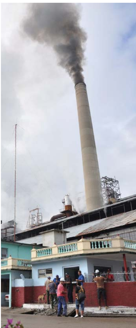
El central consiguió la mayor producción de la última década.

En el contexto de las actividades por la efeméride, al cierre de la edición se entregaban en Sancti Spíritus, provincia sede del certamen, los premios periodísticos Premio de Mayo a los colegas de todo el país distinguidos en esta oportunidad.