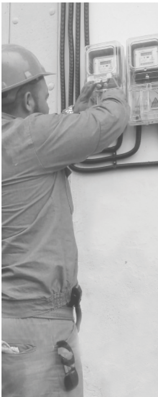
Con estos equipos el registro de la lectura es automático.