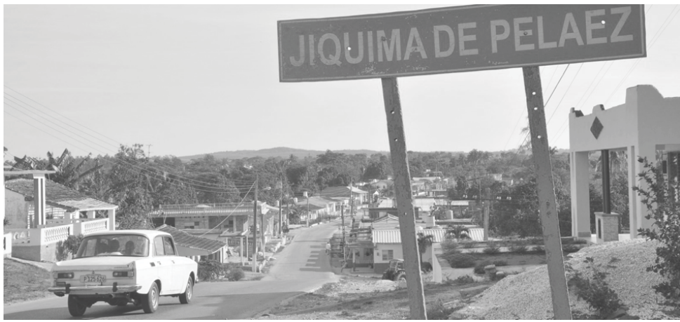
El programa de reanimación de comunidades ha sido uno de los más beneficiados por este aporte.