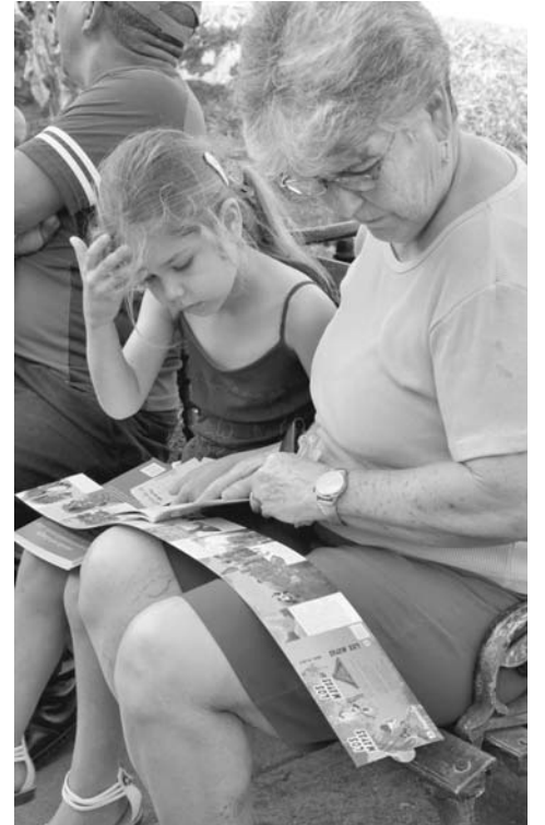
Los libros estarán dedicados a diversos públicos e intereses.

Como el inicio, la XXVI Feria Internacional del Libro se despedirá de Sancti Spiritus con un brillo muy singular, pues la compañía D' Morón Teatro regalará Cecilia, ángel de barro , un verdadero mano a mano entre la literatura, las artes plásticas y el público.