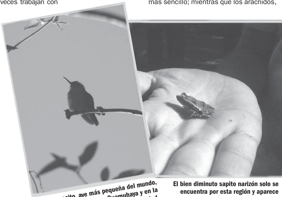
El zunzuncito, ave más pequeña del mundo, aquí ya solo se localiza en Guamuha y en la faja costera entre Cienfuegos y Trinidad.

Especialistas e instituciones no se cruzan de brazos. Entre las medidas que intentan salvar la fauna más frágil aparecen la veda que limita su caza y pesca, la creación de áreas protegidas con diferentes categorías de manejo para conservar la biodiversidad y acciones de educación ambiental y otras. Pero, a todas luces, tales empeños continúan siendo insuficientes porque el reino de los animales —en el mundo de la Biología también conocido como animalia— de Sancti Spíritus aún precisa amparo.