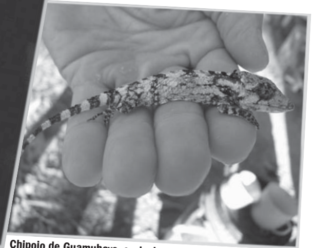
Chipoyo de Guamuha, exclusivo de esta región y con peligro para su existencia.