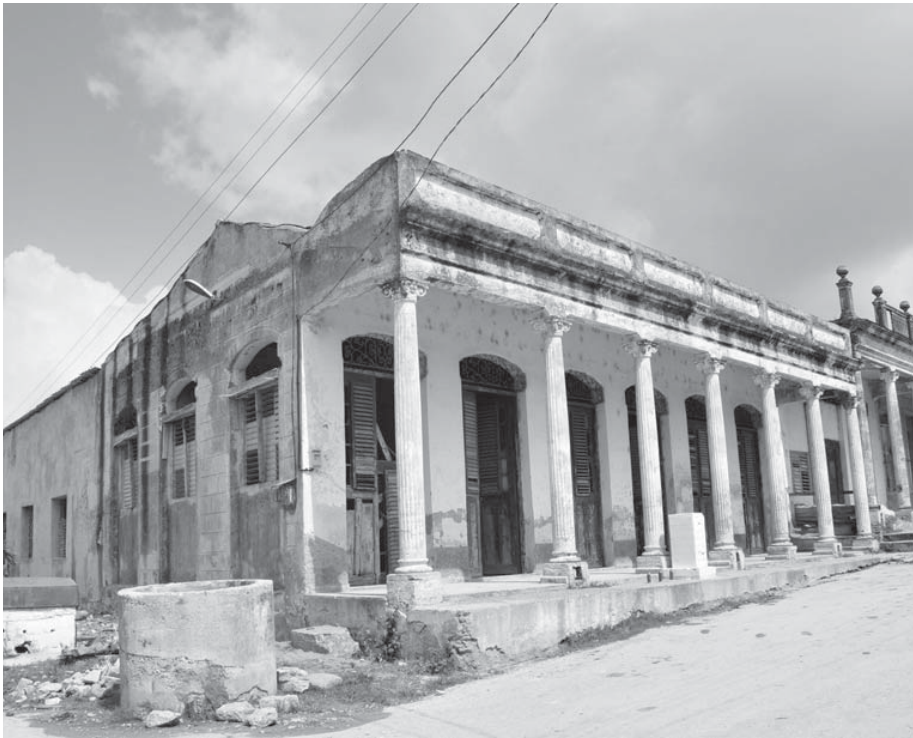
La edificación de estilo neoclásico forma parte del patrimonio arquitectónico de Taguasco.

Después de casi una década en desuso, el Palacio de Pioneros Orlando Díaz Oliva, de Taguasco, recibe una reparación capital