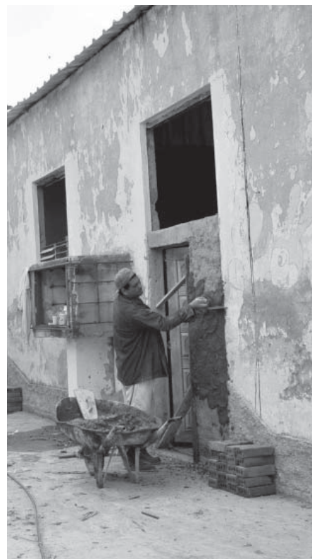
Una brigada de trabajadores por cuenta propia acomete la reparación.

Por lo pronto, esperamos que la calidad también encuentre morada en el palacio y que el próximo año lleguen hasta allí los uniformes rojos y amarillos para volver a colorear sus interiores; aulas convertidas en espacio para el conocimiento donde los estudiantes podrán complementar aptitud y destreza.