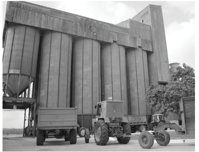
A pesar de los nocivos efectos de la sequía, el territorio avanza en producciones claves para la provincia y el país.

Según la propia fuente, la EAIG tiene concebido para el balance del 2018 explotar 46 millones de metros cúbicos de agua subterránea siempre que pueda religarse con la superficial, cifra que posibilitaría sembrar más de 2 670 hectáreas y el mayor impacto de los pozos, aclaró, puede estar en respaldar la reproducción de la semilla, proceso asentado totalmente en la Unidad Básica de Producción Cooperativa Las Nuevas.