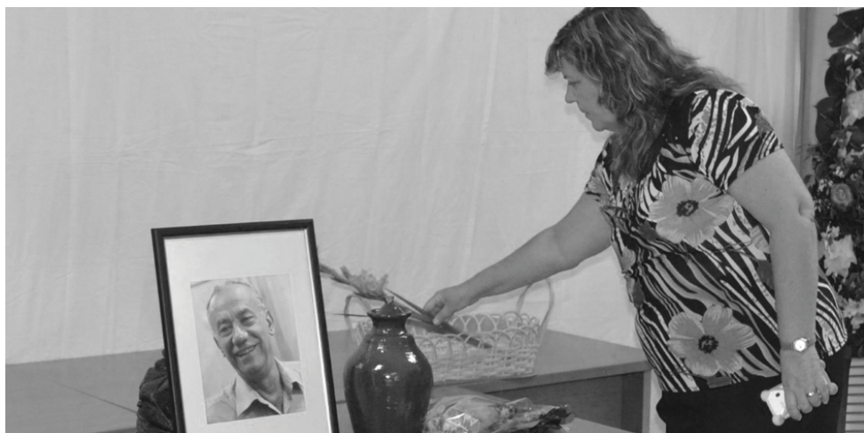
La máxima dirección del Poder Popular en la provincia encabezó el homenaje.

Subrayó el ingeniero que el fenómeno de la salinización requiere un equilibrio en la explotación del agua subterránea, de manera que permita paliar ese efecto en los suelos y mejorar el medio ambiente, una estrategia que en lo adelante formará parte del programa arrocero, respaldado integralmente por el país bajo la premisa de tener garantía del cumplimiento del plan de producción del grano con eficiencia.