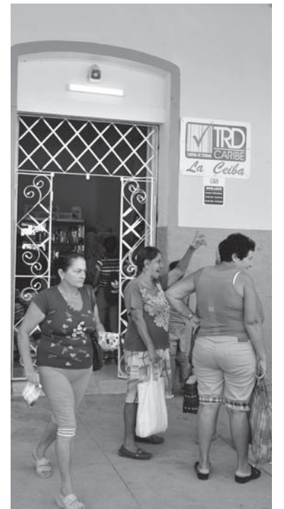
La creación de una tienda de la cadena TRD es de las acciones de mayor impacto entre los pobladores.

En la agenda de muchos quedan asuntos para otra vuelta, entre los que no escapan los huecos que quedan en las calles y viales maltratados por el tráfico de una intensa zafra, el mal estado de las redes hidráulicas y la necesidad de contar con un transporte los fines de semana. Pero en la mente de casi todos perdura el contraste entre el antes y el ahora porque, como diría una colega, Tuinucú ya no espera, no está sola o desterrada de la memoria de la gente y tampoco cuelga los guantes; la localidad, con su gente, tendrá infinitas oportunidades para seguir cambiando cosas y mantener esa imagen renovada y pintoresca que la distingue de otros bateyes cubanos.