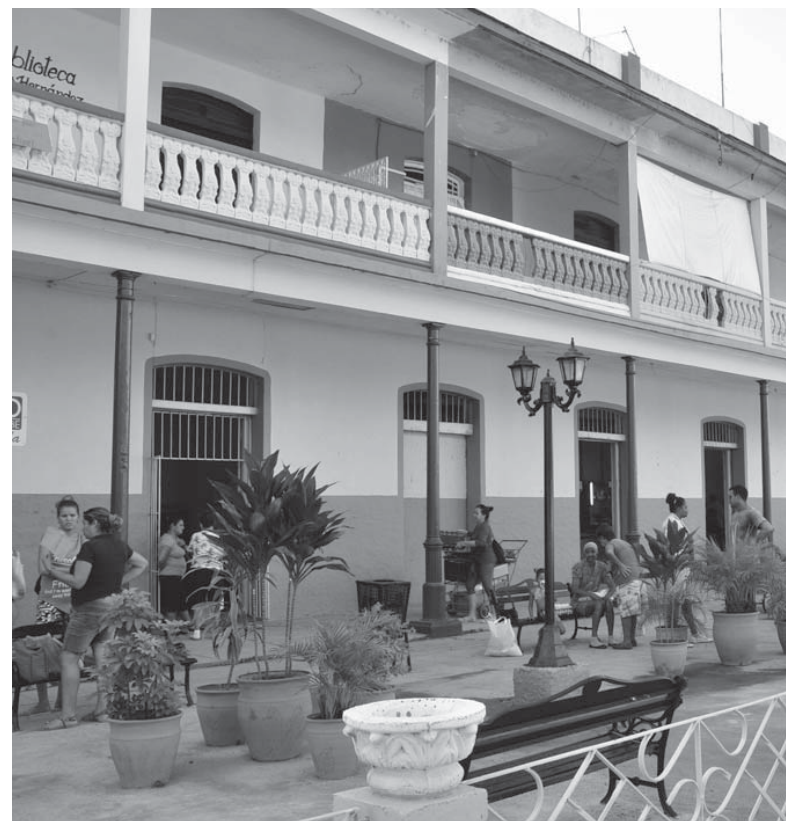
El bulvar del centro comercial es la parte más concurrida en Tuinucú.

Tuinucú sigue con la aureola de pueblo pintoresco, pero con retoques que alcanzan a la panadería-dulcería, los consultorios, la farmacia y la escuela primaria, esta última el centro más importante de la localidad en materia de formación integral, escogida como prototipo del municipio para el