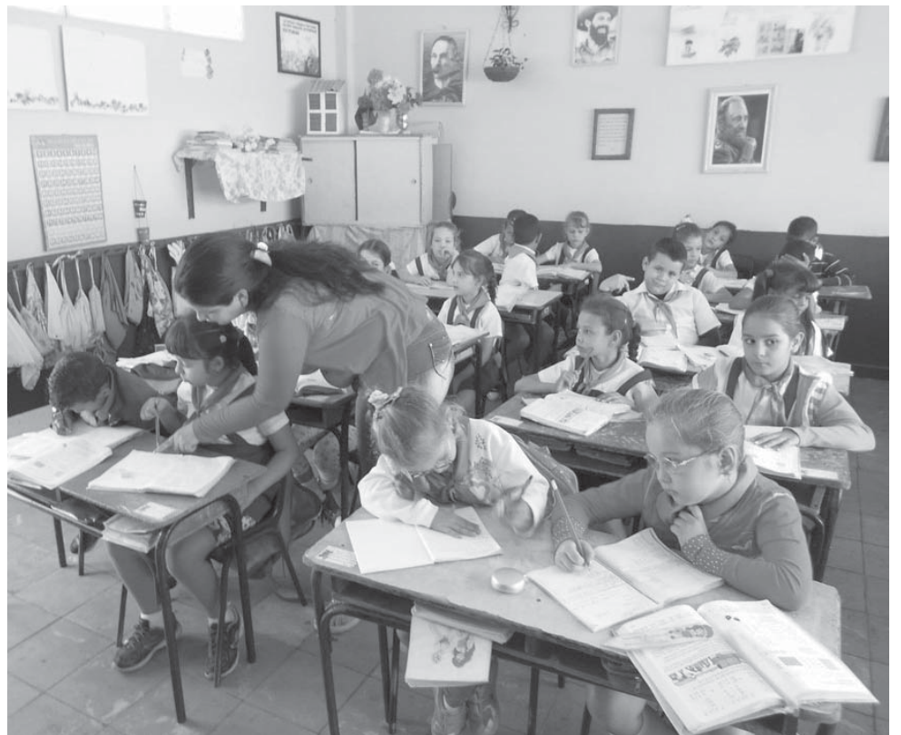
Incentivar la atención al maestro debe ser una prioridad.

De igual modo sucede con quienes ingresan a la enseñanza superior en carreras de perfil pedagógico, las cuales en algunas disciplinas no cuentan con grupos por no tener matrícula y otras han tenido sus graduaciones muy deprimidas.