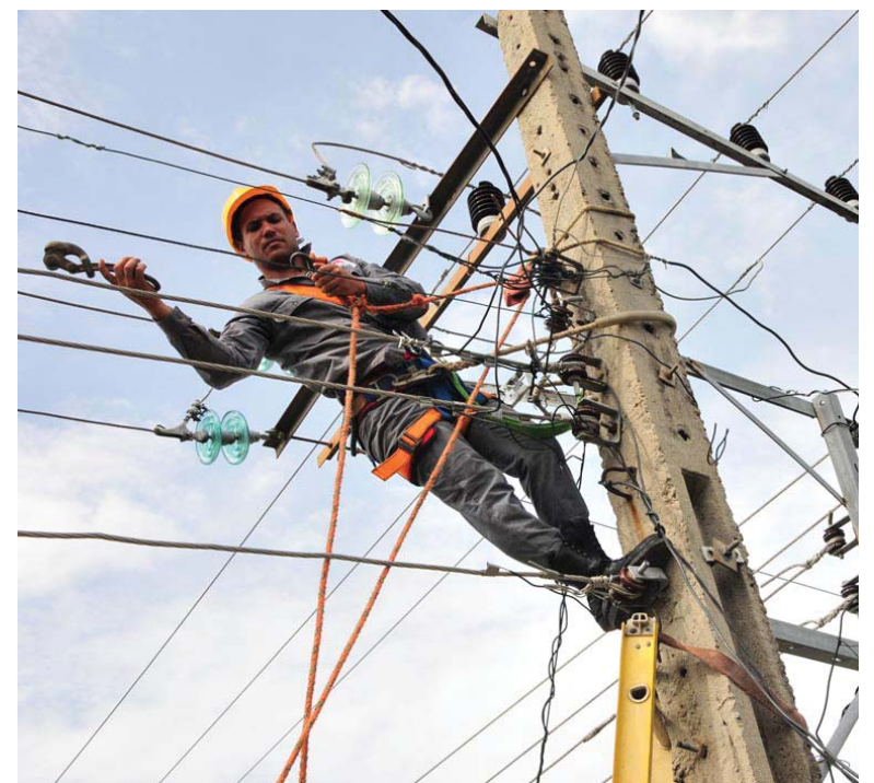
Los trabajadores del sector no han reparado en horarios.

Dos técnicos y un liniero de conjunto con las brigadas mixtas de apoyo integradas con personas de la comunidad laboran en Topes de Collantes desde este viernes: abren huecos, podan árboles y empatan cables, a ellos se incorporará hoy sábado una brigada de eléctricos espirituanos que trabajará en los cinco circuitos que abastecen a unos 1 000 clientes en esa geografía montañosa.