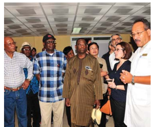
Los visitantes recorrieron el Hospital General Universitario Camilo Cienfuegos.