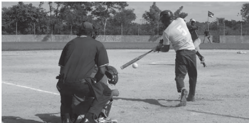
La conclusión del evento se prevé este domingo.

"Hoy hay pocos atletas en escolares y juveniles y eso nos lleva a incorporar como ahora, jugadores de béisbol que vienen a probar su fuerza aquí. Lo lógico es que sean softbolistas propios porque este deporte es diferente por completo a la pelota", concluye el jefe técnico nacional. (E. R. R.)