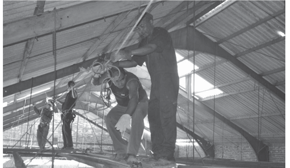
Complejas labores de reparación se llevan a cabo en el cine de Yaguajay.

Elementos aportados por la Vicepresidenta del Consejo de Defensa Municipal fueron también los relativos al sector de los Deportes, que recibió daños significativos en nueve instalaciones —seis de ellas de forma total—, y tenía el jueves ya en forma cinco. Puntualizó la fuente que Cultura recibió los impactos de Irma