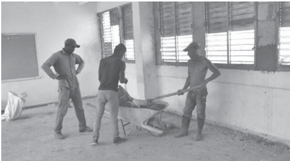
En la ESBU Camilo Cienfuegos se ejecutan actualmente el cambio de carpintería y otras labores para resarcir las afectaciones.