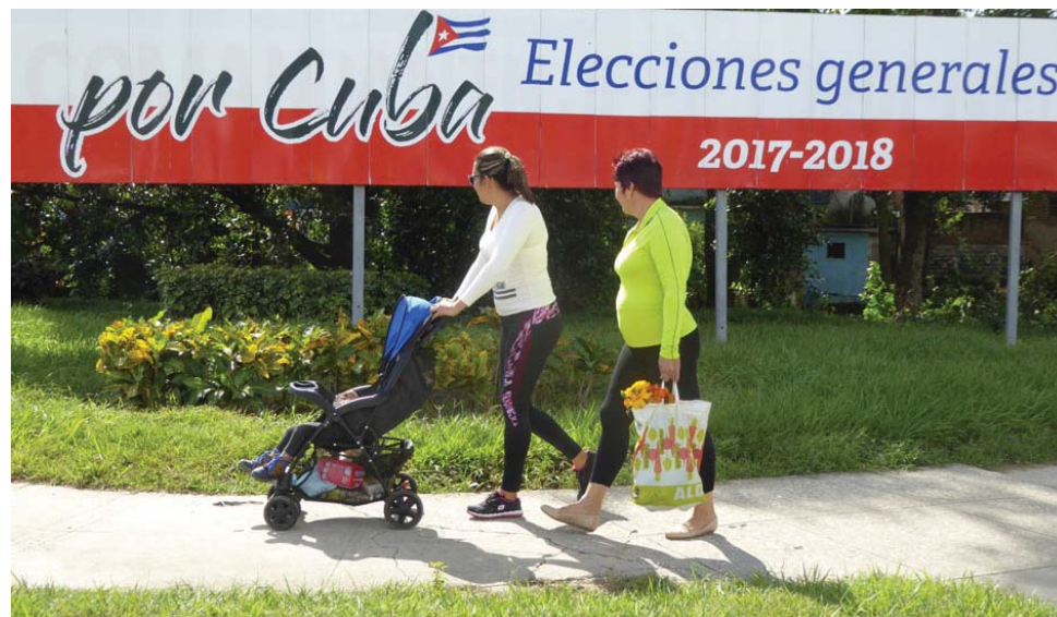
Los espirituanos se preparan para elegir a sus delegados el 26 de noviembre.

También se verificará el funcionamiento de las vías telefónicas, mensajeros, equipos de comunicación y la presencia de los radioaficionados en los lugares de difícil acceso, preparativos que permitirán conocer de antemano si los planes de comunicación se ajustan a las realidades de algunos lugares y dónde están las debilidades, en tanto dan margen a resolverlos con previsión antes del día del plebiscito.