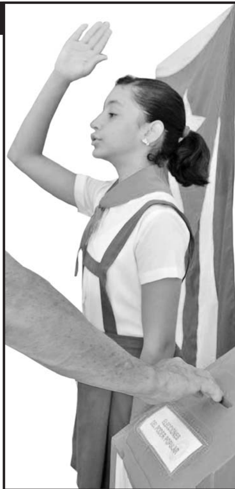
Infografía: Multimedias Escambray