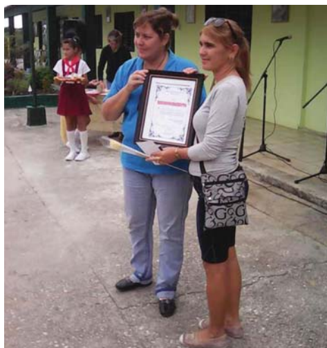
El gesto solidario de las siete familias fue reconocido en un acto efectuado este viernes.

La actitud altruista de siete familias de la comunidad de El Río, en el municipio de Yaguajay, fue resaltada este viernes con la entrega de la Medalla José Tey, en reconocimiento a quienes no vacilaron en disponer de sus espacios privados para acoger a alumnos y maestros de la escuela Boris Luis Santa Coloma, una de las 137 afectadas en la provincia por el huracán Irma.