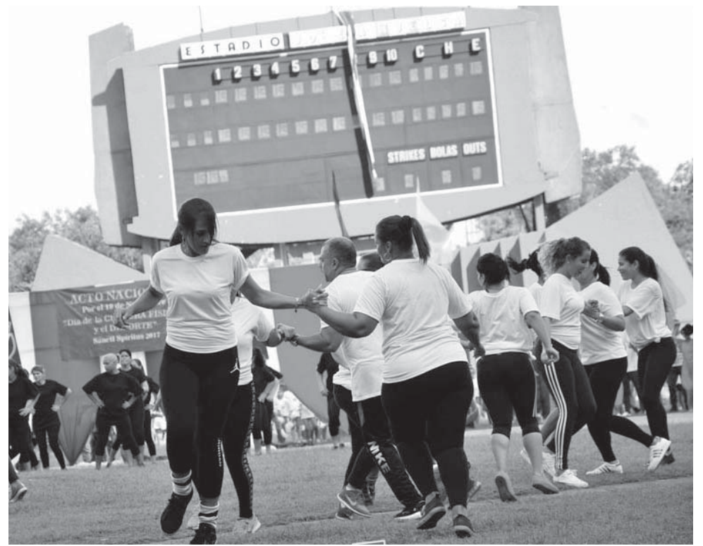
Sancti Spiritus acogió varias celebraciones nacionales del sector.