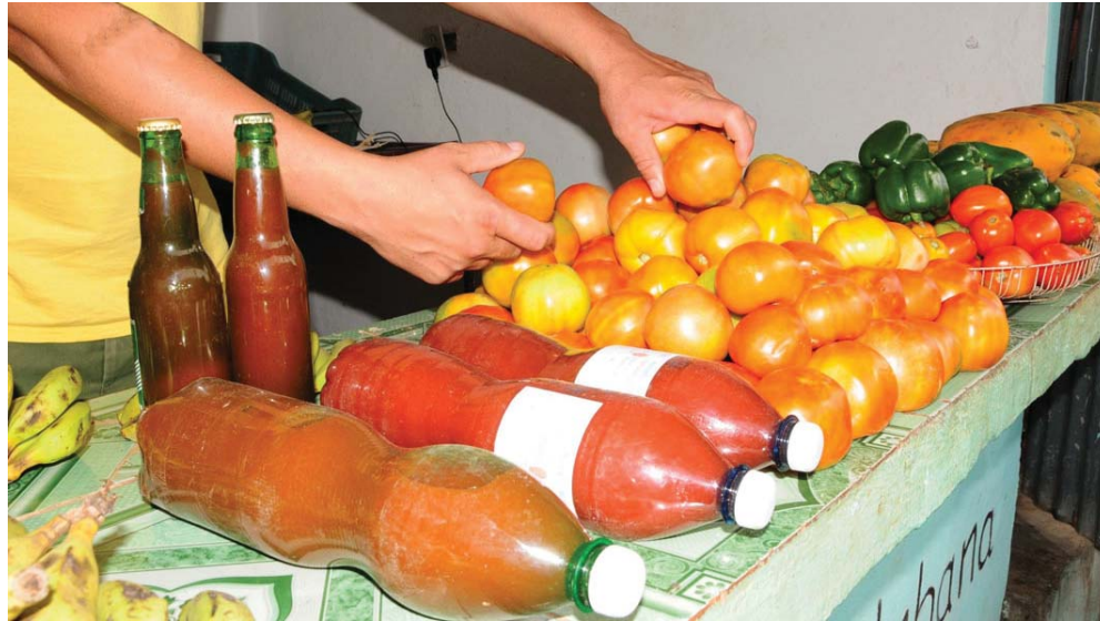
En los MAE, el tomate se deberá comercializar a 4.20 pesos la libra.

No han sido las únicas coyundas: la Policía Nacional Revolucionaria ha decomisado pro-