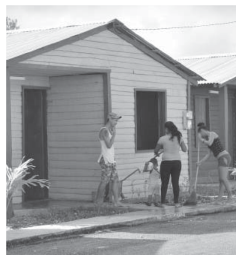
Las nuevas casas han sido muy bien acogidas por los damnificados.