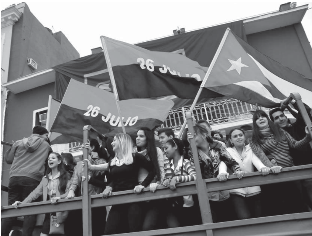
La elección resulta un reconocimiento a toda la juventud espiritvana.