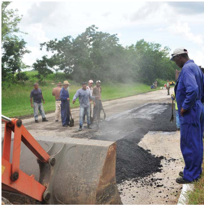
El Centro Provincial de Vialidad ha previsto este año verter unas 12 000 toneladas de asfalto en carreteras del territorio.

La construcción del puente de Siguaney, destruido desde las lluvias del 2012, es la única inversión que para este año tiene aprobado el Centro Provincial de