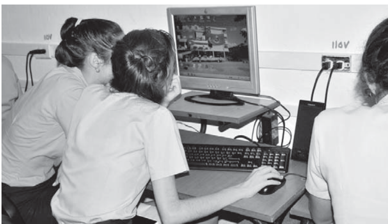
En los laboratorios de Informática de las escuelas se encuentran materiales digitales para el estudio individual.