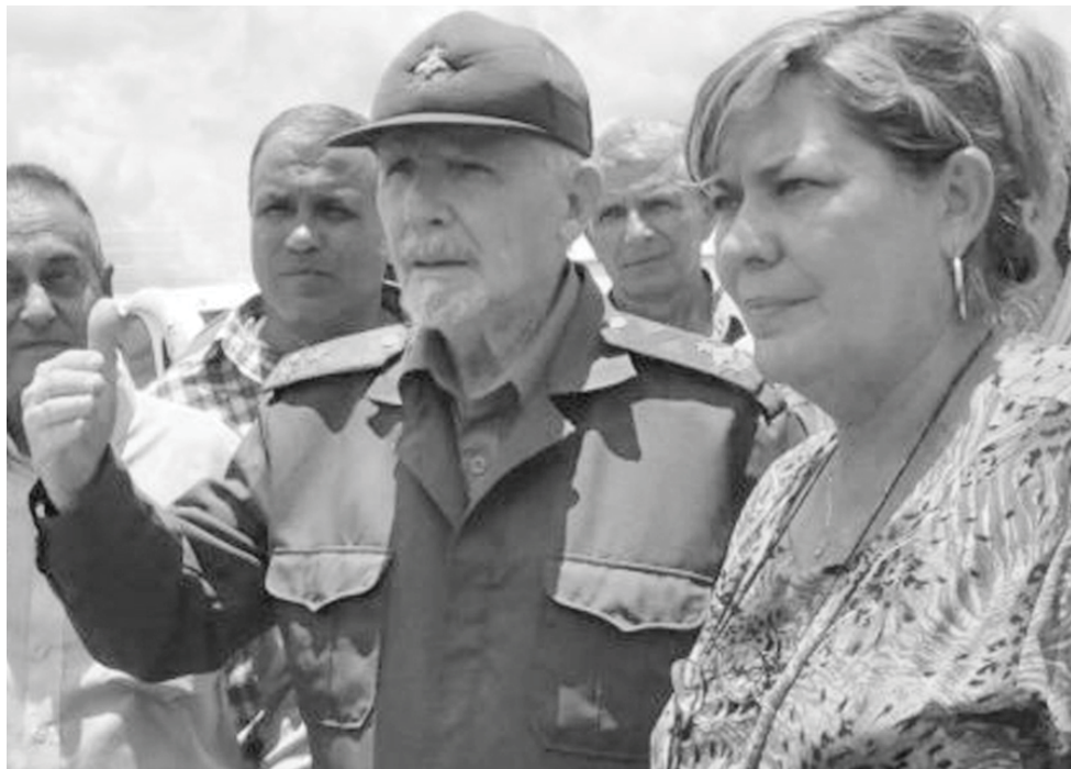
Con el Comandante de la Revolución Ramiro Valdés durante un recorrido por La Sierpe.

Cuando uno tiene esta responsabilidad quiere cumplir, quiere que todo salga y le dedica bastante tiempo a la parte laboral y quizás a la familia no le dedica todo el tiempo que debiera. Es complicado, yo sí tengo el apoyo de mi familia y mi esposo me ayuda muchísimo, mi hija también, realmente sin el apoyo de la familia sería imposible dedicarle el tiempo que uno le dedica a esto.