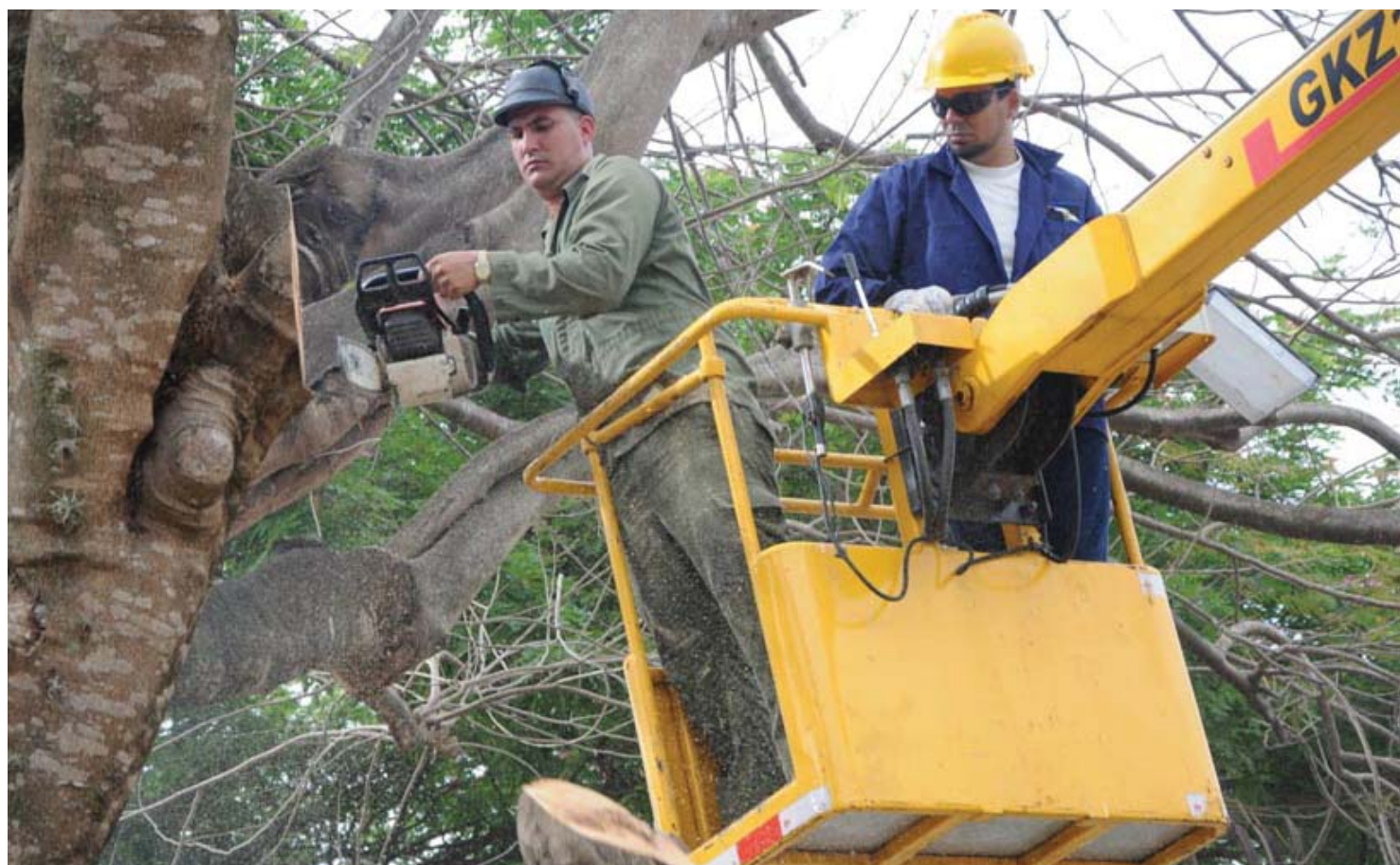
La poda de árboles para evitar daños provocados por huracanes figura entre las principales acciones del ejercicio popular.

Añadió la fuente que está previsto el desarrollo de audiencias sanitarias en las que se enunciarán las medidas de prevención ante grandes epidemias generadas por vectores y significó que una de las actividades