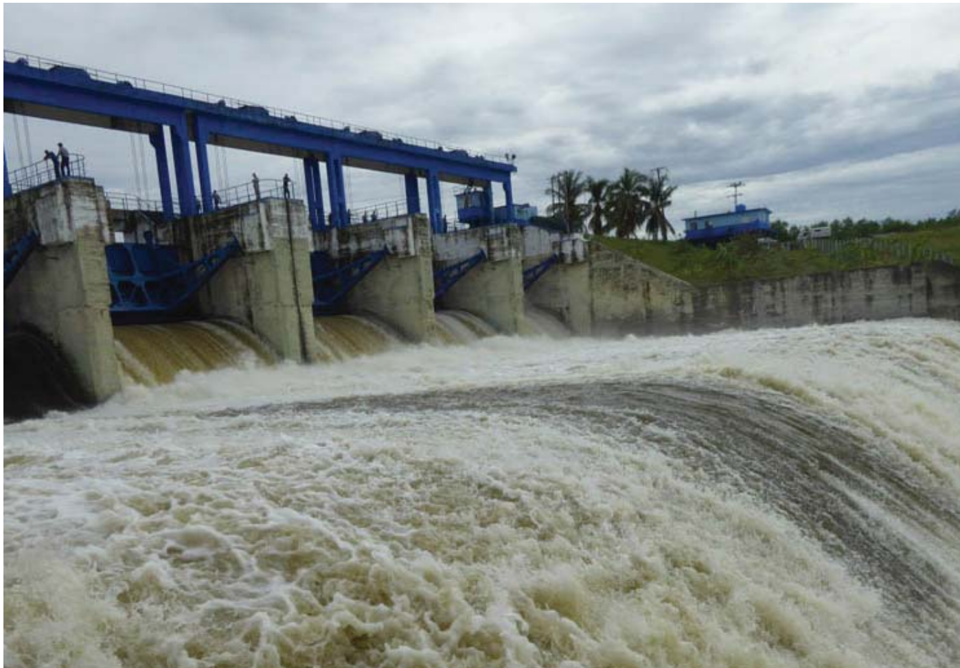
Ante la nueva situación meteorológica, a la Zaza se le bajó el volumen para facilitar su operatividad.