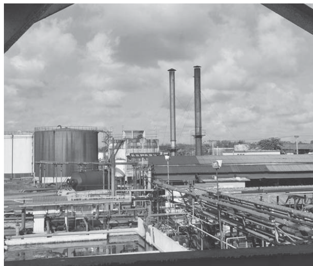
Un amplio programa de inversiones ha desarrollado la Sergio Soto durante los últimos años.