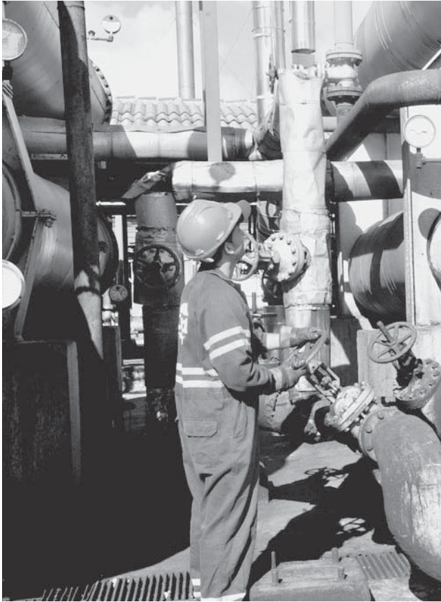
La refinería cabaiguaneña es la única que trabaja con la materia prima procedente de la isla.