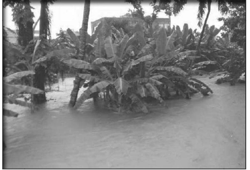
Severos daños sufrieron plantaciones de plátano y otros cultivos.