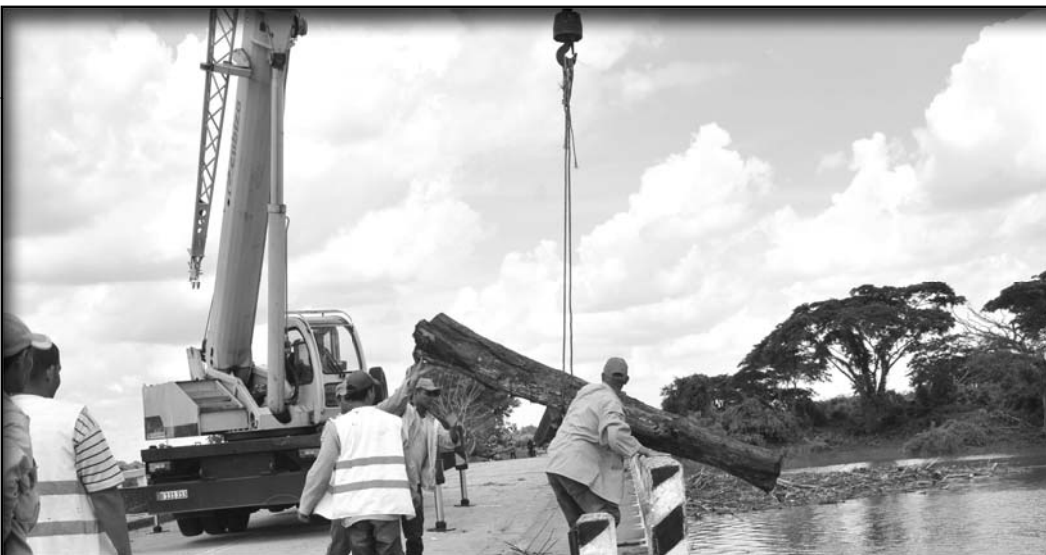
Intensos trabajos requirió la desobstrucción del puente sobre el río Zaza en la Carretera Central.