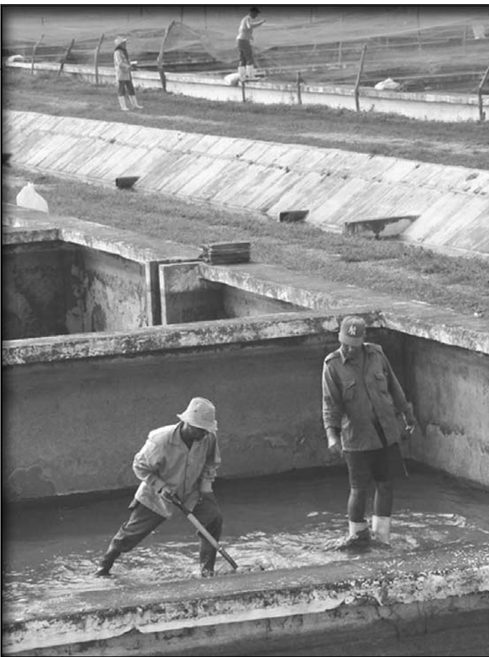
Entre las instalaciones más golpeadas en el territorio figura la Estación de Alevinaje de La Sierpe.