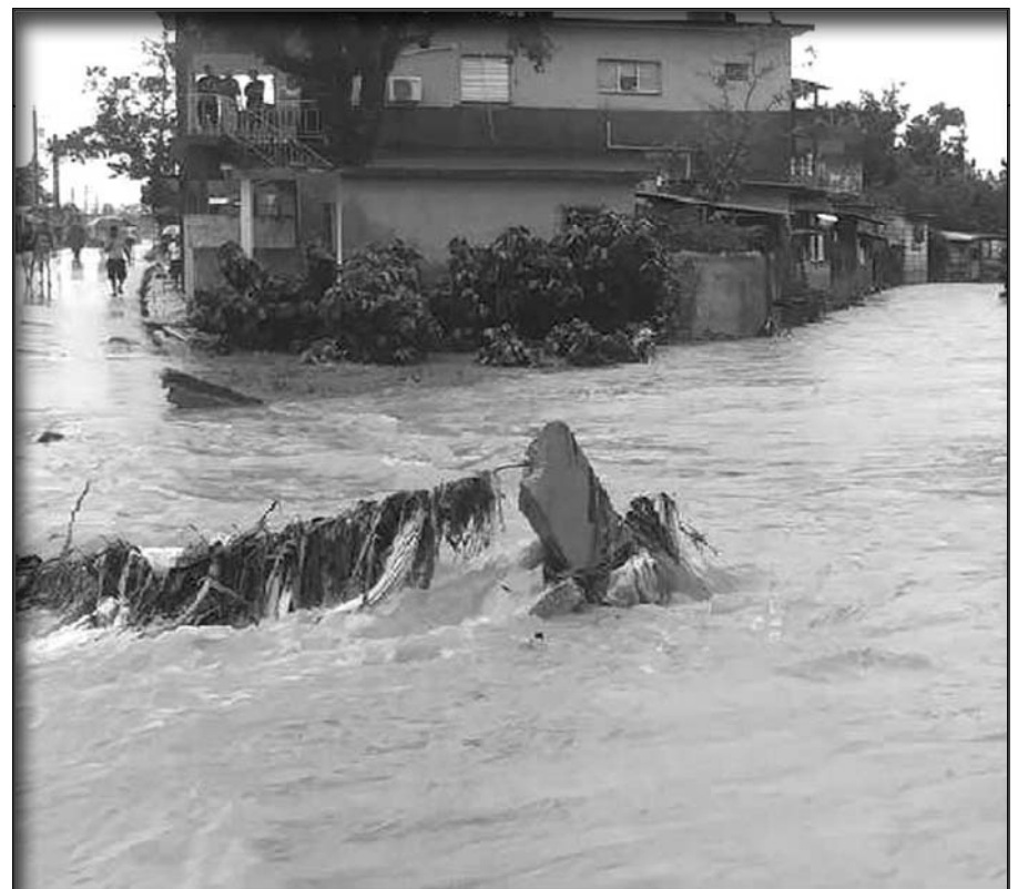
Algunas calles de Cabaiguán simulaban verdaderos ríos crecidos.