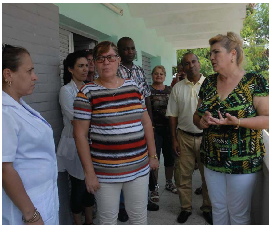
Un nuevo laboratorio de Microbiología habilitado en función del Programa de Atención Materno Infantil comenzó a funcionar en el Policlínico Norte.