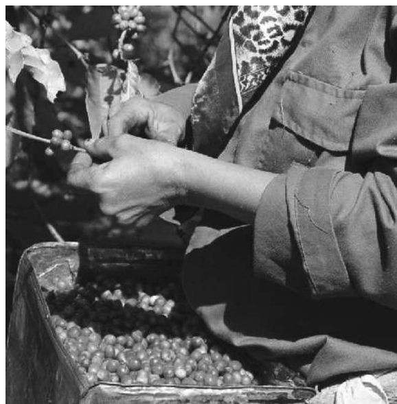
La cosecha iniciará en septiembre por la premontaña de Fomento y Trinidad.

No obstante, a la suficiente disponibilidad de posturas para cubrir las 220 hectáreas planificadas —casi la mitad en las áreas atendidas por las fuerzas del EJT incorporadas al cultivo—, la siembra cerró julio con un avance de 82 hectáreas, por debajo de lo previsto, motivado, según Cruz Duardo, por la sequedad del terreno, de manera que se concentra para agosto y septiembre el grueso de la plantación, actividad que exige apurar