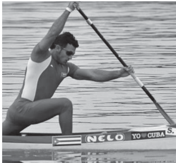
El espirituaño no ha dejado de entrenar para la Copa Mundial de Canotaje a celebrarse en Portugal.

En Campeonatos del Mundo, a la dupla cubana y a Serguey en particular solo le resta subir a lo más alto del podio, lugar del que estuvieron bien cerca en la edición del 2017, cuando lograron plata en el C-2 y el espirituaño igual medalla en el C-1 a 1 000 metros, que en total suman siete preseas en estas