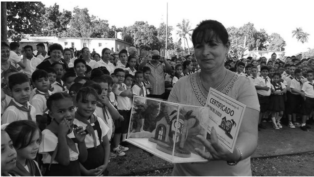
La escuela primaria Noel Sancho, de Cabaiguán, mereció el Premio del Barrio.