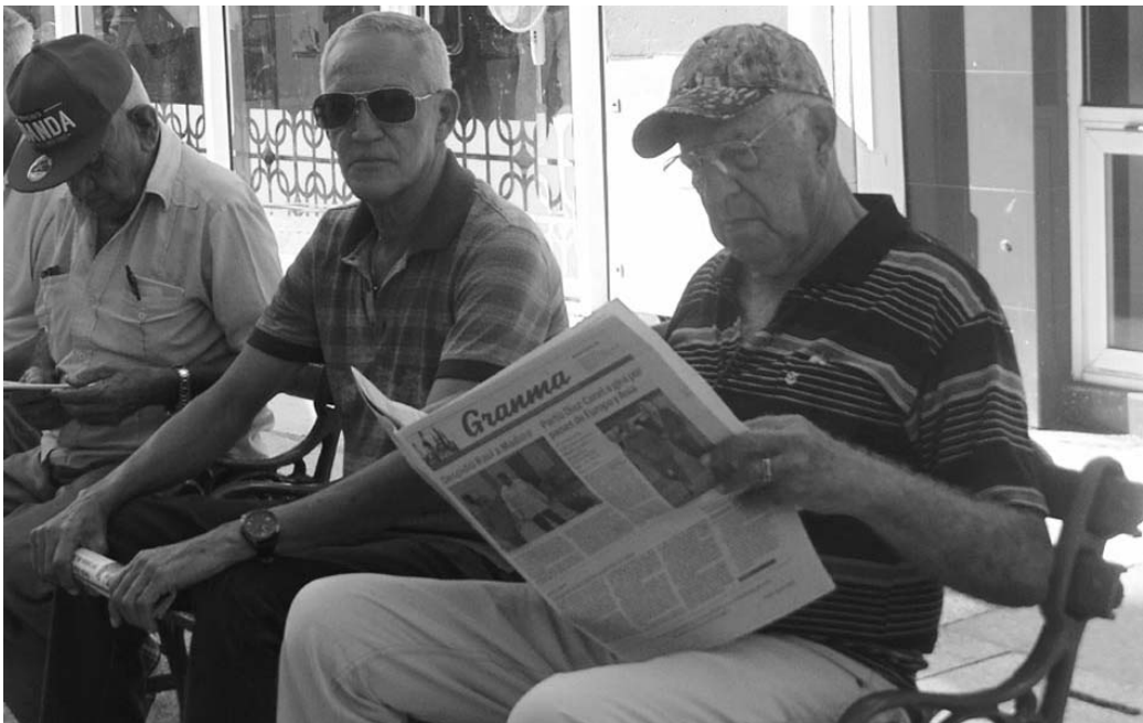
A partir del primero de noviembre se hizo efectiva la medida.