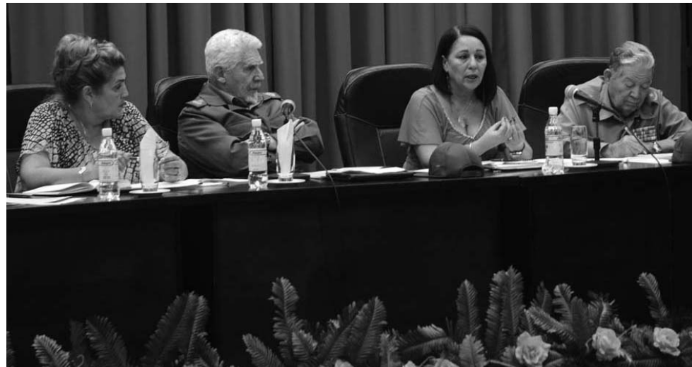
El Vicepresidente de los Consejos de Estado y de Ministros expresó que se precisa ordenar el catálogo de soluciones de proyecto de las viviendas.

Tal fue el llamado de Ramiro Valdés Menéndez, vicepresidente de los Consejos de Estado y de Ministros, quien criticó, además, irregularidades en torno a este programa