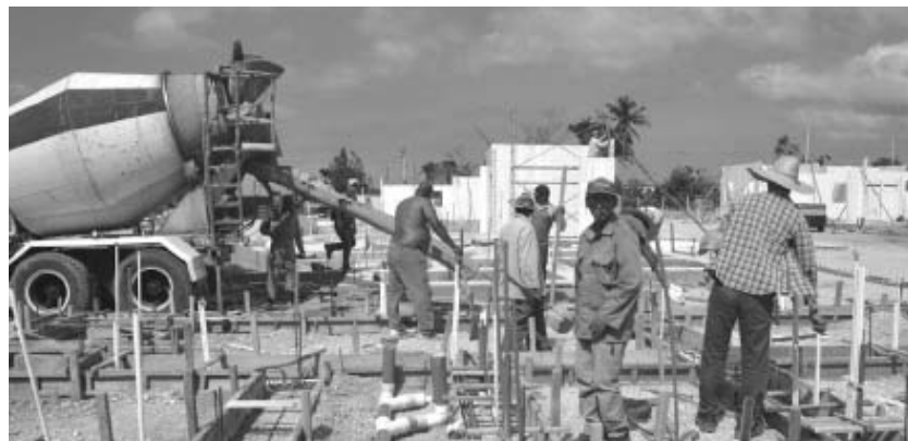
En el norteño municipio se levantarán 50 de estas viviendas.

Otro centro que pudiera ser renovado es la biblioteca de la sede universitaria, que radica en el antiguo hotel Las Villas, la única edificación —añeja y desaliñada— que queda sin reanimar en este populoso lugar de la ciudad.