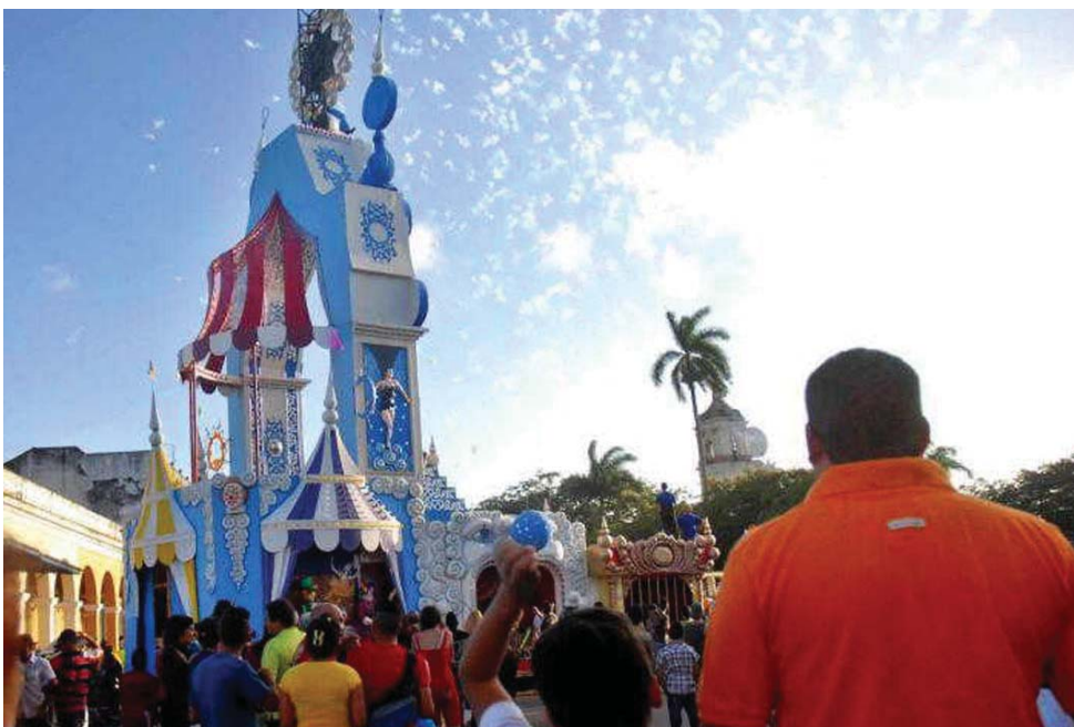
Estos festejos sobresalen por su aceptación popular y la recreación de mitos y leyendas.

Después que un árbol gigantesco derribara sin piedad varias columnas del puente que une la comunidad taguasquense con la capital espirituana, a raíz del temporal de mayo último, parecía que las dos orillas demorarían años en juntarse. Pero seis meses más tarde, gracias al empeño de cientos de hombres, se hace el milagro