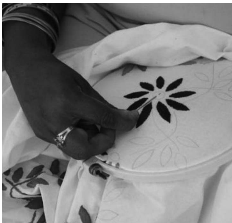
Las técnicas de Trinidad han llamado la atención de quienes apuestan por visitar Fiart.