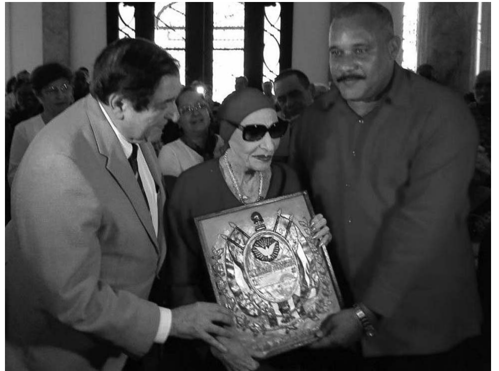
Alicia Alonso posee el Escudo de la Ciudad de Sancti Spíritus.

“No he realizado las piezas una tras otra. Hacía una serie y la guardaba y así, poco a