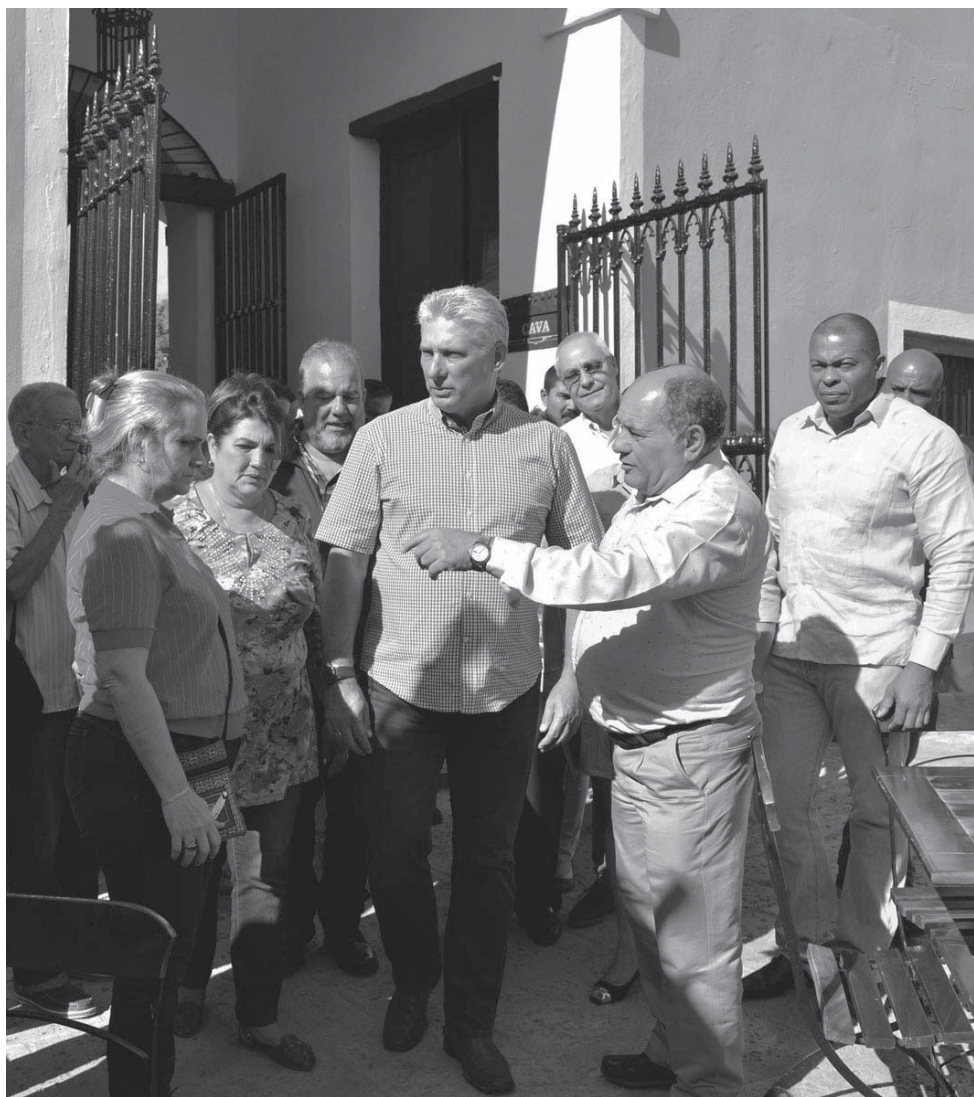
Sitios relevantes para el desarrollo turístico en la villa trinitaria estuvieron en la agenda del Presidente cubano durante su recorrido por la provincia.