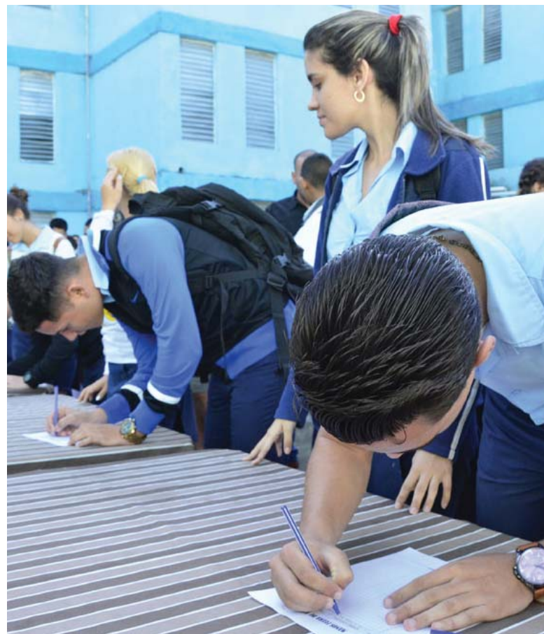
Los estudiantes del preuniversitario Honorato del Castillo, de la capital provincial, se solidarizaron con la Revolución Bolivariana.

El actual proceso de recolección de firmas posee como antecedente otro similar desarrollado en Cuba en el 2015, cuando el pueblo exigió por esta vía la anulación de la orden ejecutiva emitida por el entonces Presidente Barack Obama, documento que calificaba al país sudamericano como una amenaza para la seguridad de los Estados Unidos.