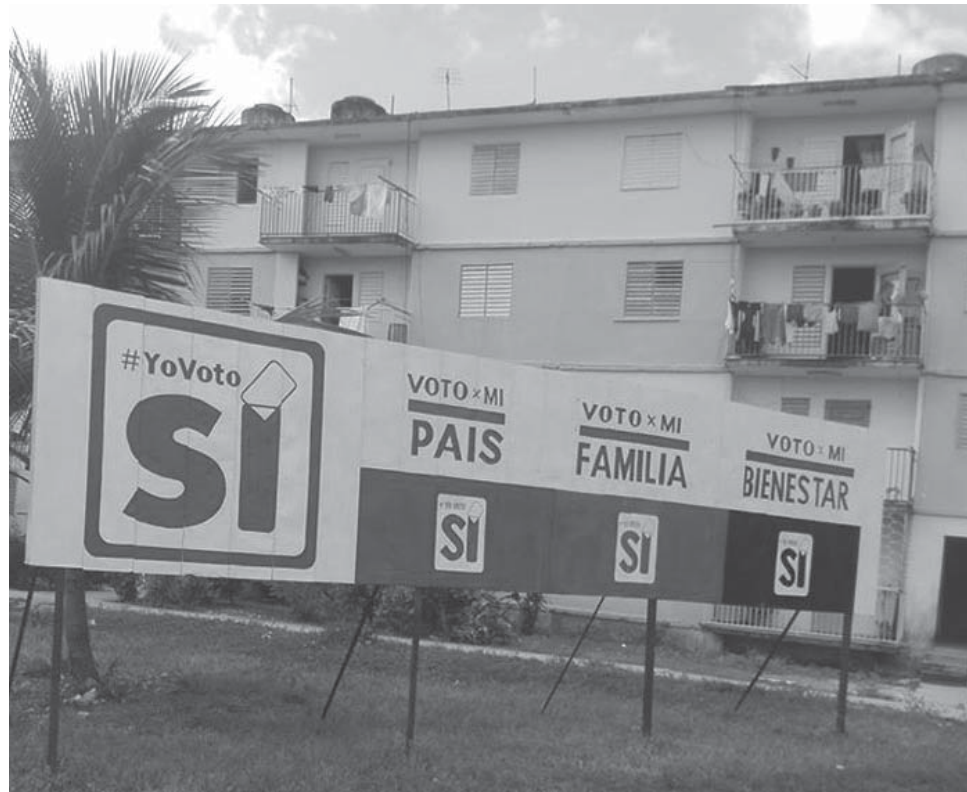
Más de 367 860 espirituanos están convocados a participar en el referendo sobre la nueva Carta Magna, que tendrá lugar el domingo 24 de febrero.

referendado una Constitución y los últimos lo hicieron hace 43 años, en 1976. Ahora cada ciudadano cubano tendrá la oportunidad de votar por la nueva Carta Magna con una simple cruz en la casilla con el Sí o el No. Debemos explicar a las personas cómo votar porque si marcas las dos casillas la boleta será anulada, si se escribe alguna frase además del Sí y no se puede determinar la voluntad del elector, también se invalida. Los colegios abrirán desde las