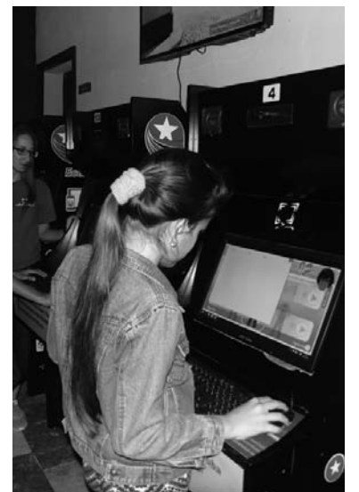
Cinco Joven Club de la cabecera provincial ya disponen de esa conexión.

Otras inversiones para incrementar las prestaciones en los propios locales de Joven Club implicaron una alianza con la Empresa de Telecomunicaciones de Cuba, que derivó en la creación de dos sitios para la conexión por wifi, uno en Kilo-12 y otro en Jatibonico, que Pérez Reina valoró de muy oportunos, ya que los parques públicos habilitados se encuentran lejos de las instalaciones.