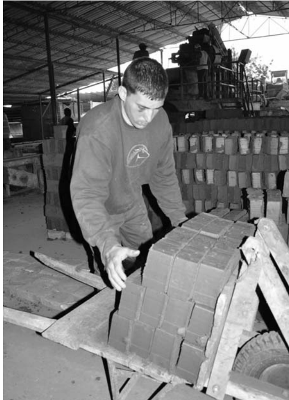
Como parte del ordenamiento en el territorio, los tejares y aserriños deben alejarse de los centros urbanos.

“En Sancti Spíritus tenemos un área de crecimiento en los tejares Camilo Cienfuegos y Conrado Benítez, por la carretera de El Jíbaro, donde ya se hicieron los estudios y se entregó la documentación para construir