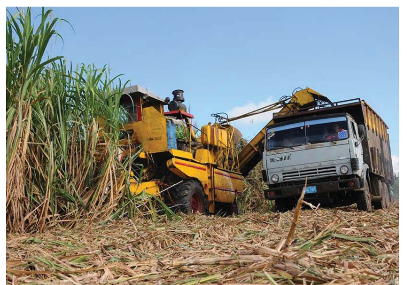
Las labores de corte pueden ser afectadas en mayo por la lluvia.

Destacó Pérez Siberia que desde el comienzo la zafra ha estado afectada también por la no incorporación de 18 camiones al traslado de materia prima, mientras repercute negativamente en la cosecha la caída del estimado cañero en más del 60 por ciento de las unidades productoras, lo que representa un déficit de unas 70 000 toneladas de caña, de ahí la estrategia de trasladar materia prima desde las provincias vecinas.