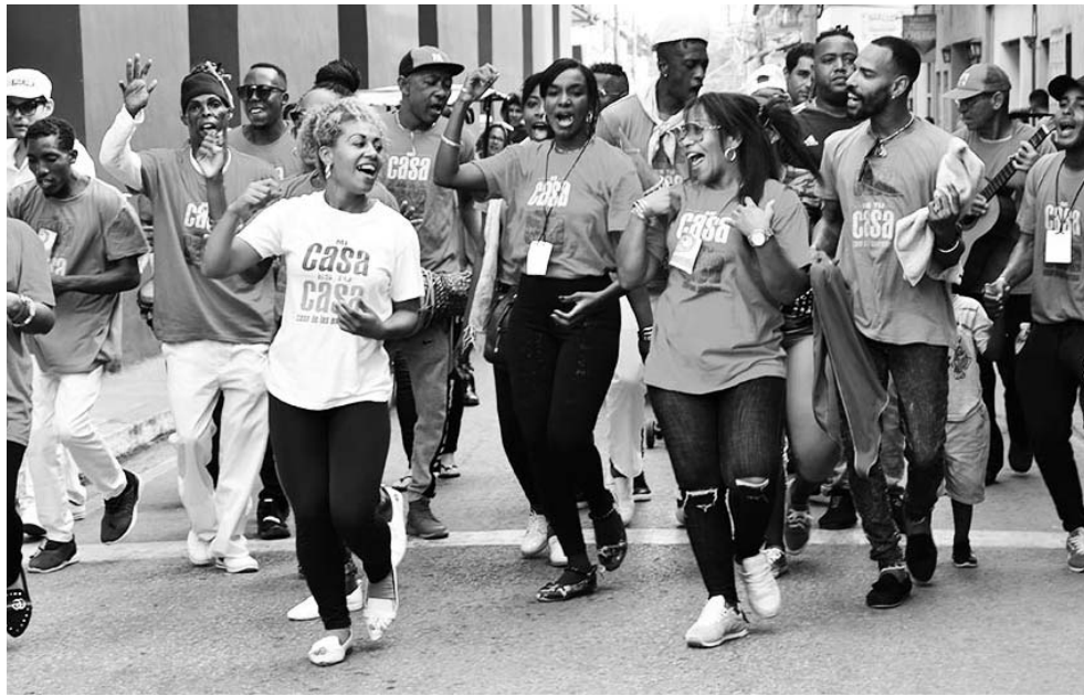
Diversas manifestaciones confluyen cada año en la tierra yayabera durante la cita del arte callejero que convoca a invitados de varias provincias del país.

Este sábado se despiden las propuestas del evento, auspiciado por la Asociación Hermanos Saíz en Sancti Spíritus, con un concierto del cantautor Luis Franco