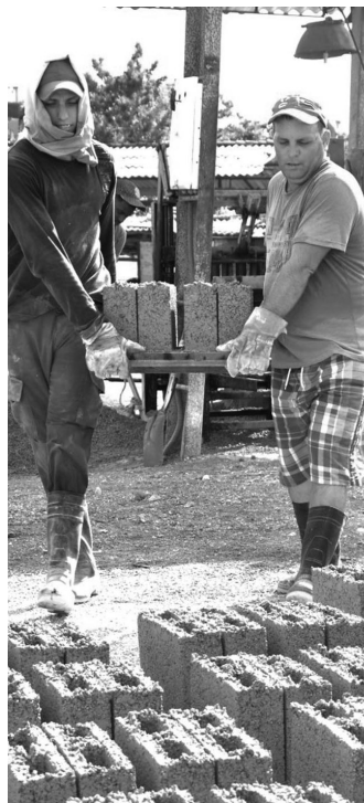
Cada municipio puede garantizar los recursos para construir viviendas.

“Actualmente no existen casos de coronavirus ni en Sancti Spíritus ni en Cuba. Pese a que se han reportado infecciones respiratorias agudas con cierta gravedad, cursan con un comportamiento normal para este período estacionario en el que nos hallamos”, sostuvo la doctora.