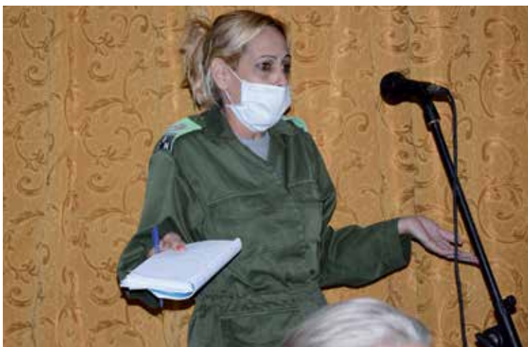
El análisis giró alrededor de una idea medular: ¿cómo producir y comercializar más alimentos en las condiciones actuales?