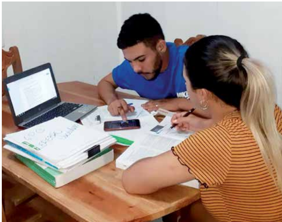
Para los estudiantes ha sido una experiencia nueva, que les ha impuesto retos y les abre oportunidades.

Seis días antes la detección de los primeros casos positivos a la COVID-19 en Trinidad sería un parteaguas en la vida de todos. Al menos para los estudiantes de Medicina, como para los de otras especialidades, comenzaría, tal vez, otra carrera: la de las pesquisas diarias casa a casa, la de las conferencias para aprender de bioseguridad ante el nuevo coronavirus, la de los trabajos online , la del estudio a solas en el hogar, la de adentrarse en la teoría sin poder ponerla en práctica, la de Internet para acortar distancias y compartir conocimientos.