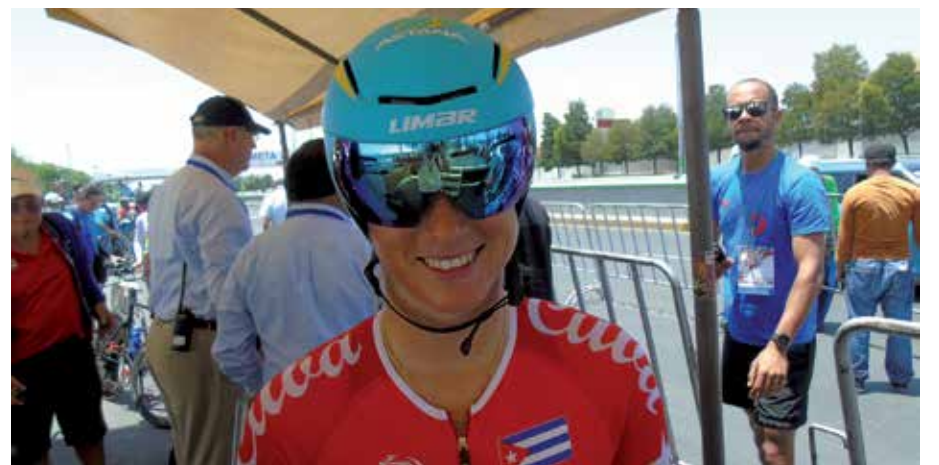
Heydi ya ha probado las carreteras en busca de otros derroteros.