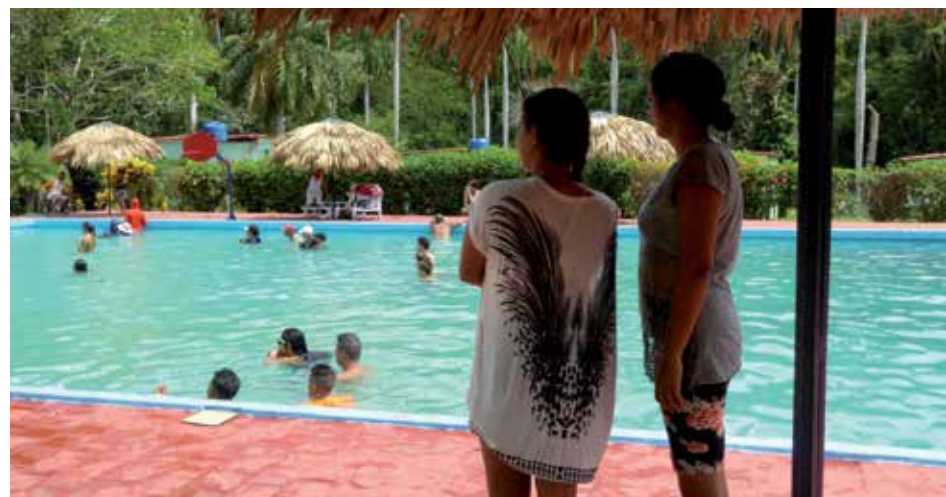
Todas las piscinas del territorio estarán abiertas bajo estrictas medidas de bioseguridad.

Las playas de ambos litorales estarán abiertas al público, así como las 42 áreas de baño autorizadas en toda la provincia, lugares que contarán con los aseguramientos gastronómicos y de la Cruz Roja.