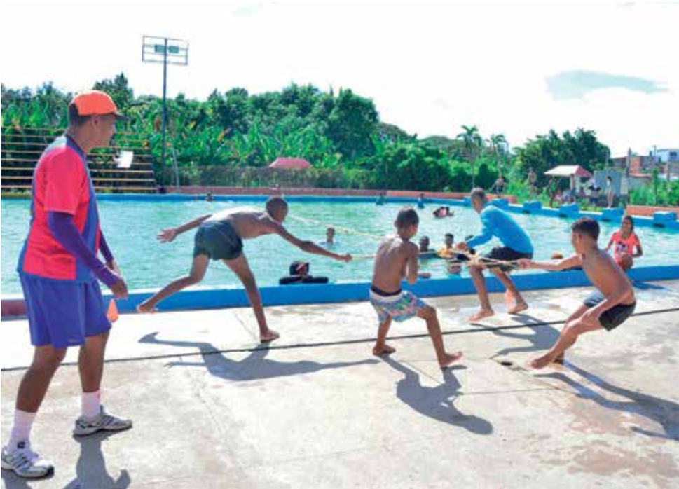
El deporte debe ser asidero recreativo en un verano donde el resto de las opciones, incluidas las culturales, son más limitadas.