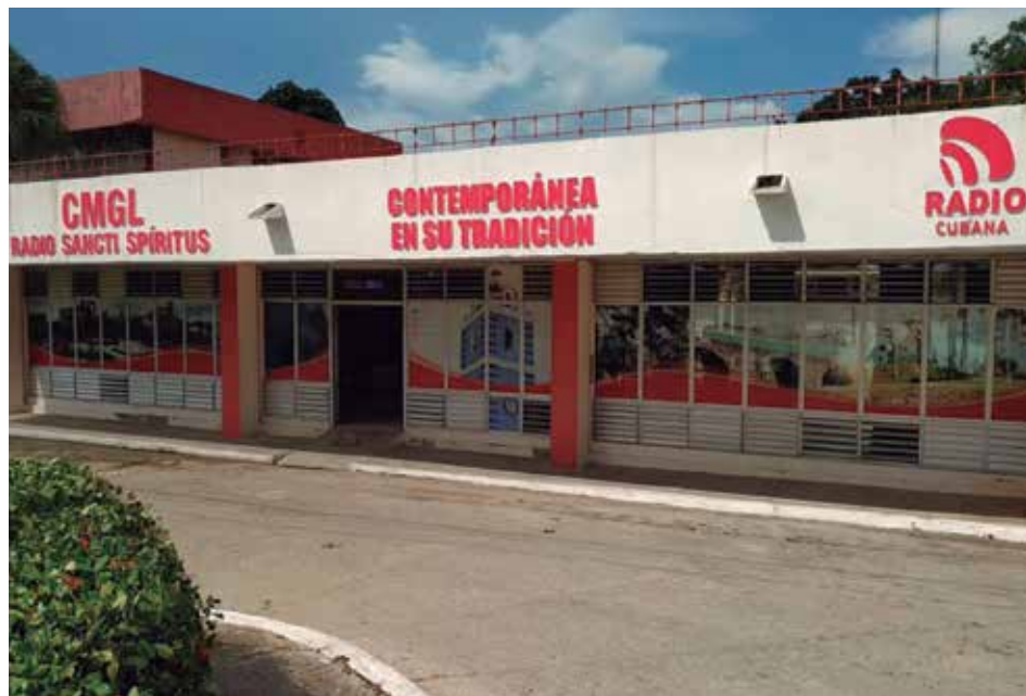
Desde hace 75 años los espirituanos han acogido la radio en el territorio como una compañía inseparable, capaz de entretener e informar con inmediatez.

El 11 de julio de 1945 se registra como la fecha de inicio de las transmisiones de la radio espiritana. Más de siete décadas después sigue tejiendo su historia