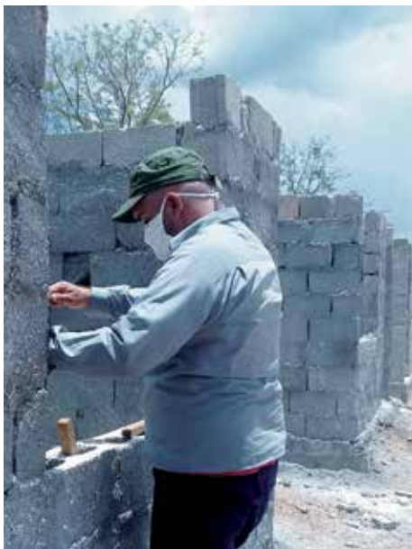
La propia empresa financia y ejecuta con sus fuerzas la construcción de las casas en La Sierpe.

Texto y foto: José Luis Camellón Álvarez