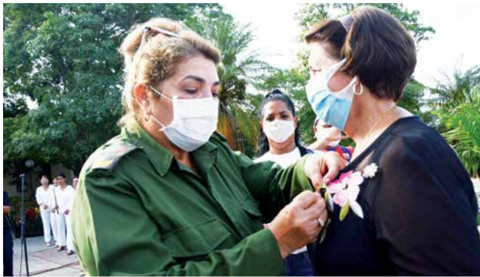
La Presidenta del Consejo de Defensa Provincial participó en la entrega de reconocimientos.