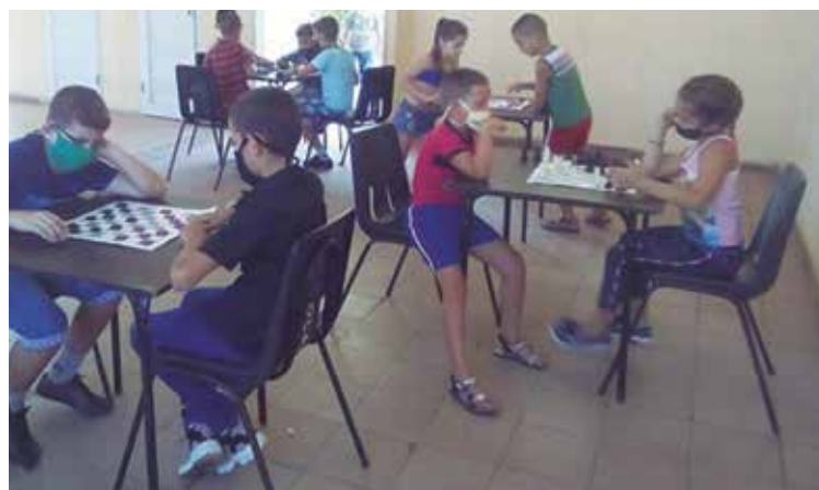
Los juegos pasivos figuran entre las principales opciones recreativas.

“Aunque la actual etapa veraniega se asume con regulaciones sanitarias, los estudiantes espirituanos y la familia en general pueden disfrutar de amenas propuestas que enriquecerán sus espectros educativo y recreativo”, concluyó la propia fuente.