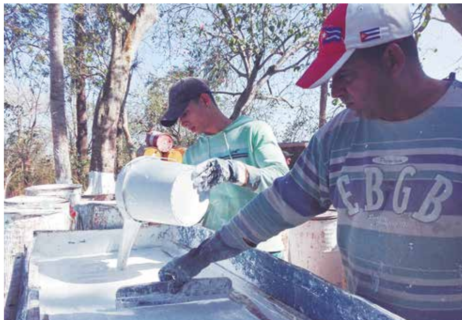
Esta minindustria puede elaborar más de 500 000 litros de pintura al año.

La minindustria de pintura artesanal de Guayos aportó al presupuesto del Estado más de 1 700 000 pesos en la presente campaña de pago de tributos, a raíz de la fabricación de este producto, empleado en obras de Sancti Spíritus y Villa Clara