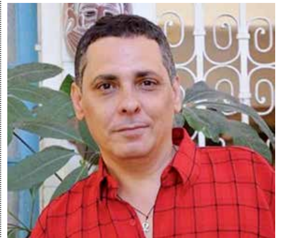
Sigfredo Ariel se distinguió a nivel de país como poeta, realizador de radio y crítico musical.