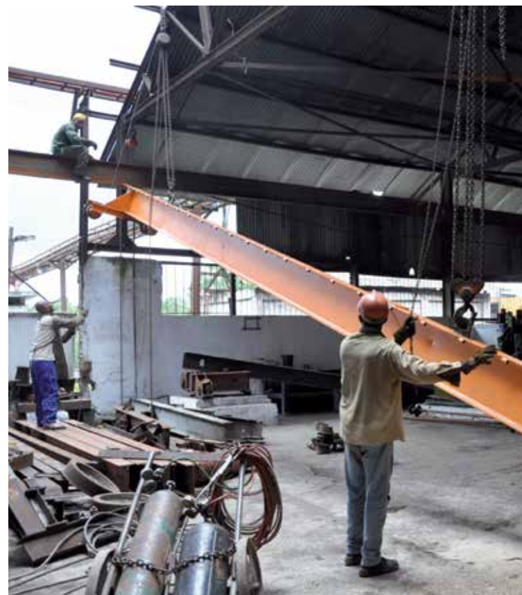
La provincia exhibe ligero adelanto en el cronograma y ha ejecutado alrededor del 30 por ciento del plan de reparaciones.

“Todos estos trabajos que se acometen apuntan a lograr mayor calidad en la materia prima, a un mejor aprovechamiento del transporte automotor y ferroviario y todas son medidas a favor de la eficiencia, pero el problema de la zafra en Sancti Spíritus sigue siendo poner en los dos centrales la caña disponible que se va a moler”, señaló Pérez Siberia.