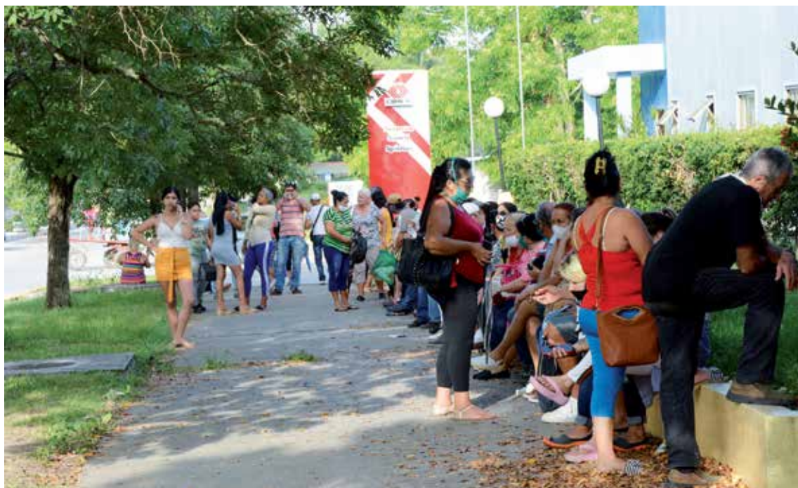
Varias personas aguardan diariamente para solicitar su tarjeta en las afueras de Fincimex.