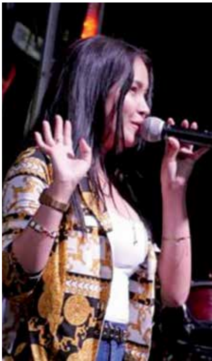
Para ella no hay mejor satisfacción que poder escuchar a las personas coreando sus temas.

“Toda mi familia lleva el Yayabo con mucha honra. Crecí en La Habana, a la cual quiero, pero mi hogar es Sancti Spíritus, aún tengo a mi sobrino, muchos primos y amigos”.