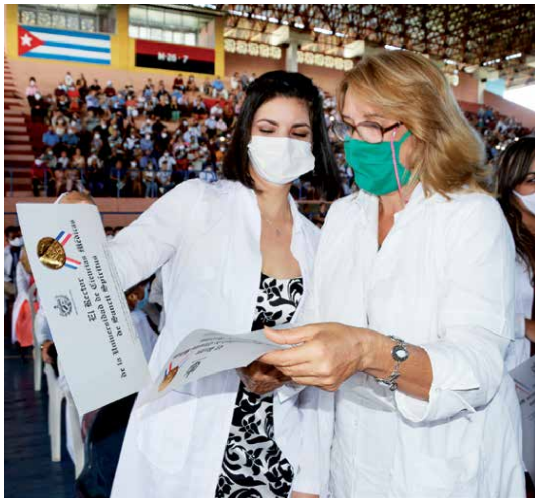
Este año las graduaciones se realizaron en cada uno de los municipios para evitar la aglomeración de personas, sin descuidar las medidas higiénico-sanitarias.

Quienes ya hoy colgaron en las paredes sus títulos de graduados han dejado atrás muchísimos años de estudio para comenzar en septiembre otra escuela, tan sacrificada y exigente como la universidad misma: la del día a día.