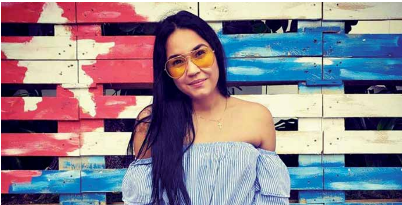
Shiina es cantante, compositora y realizadora de videoclips.