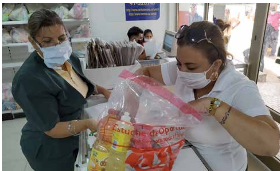
Los clientes destacan la calidad de los combos que se venden en Sancti Spíritus.