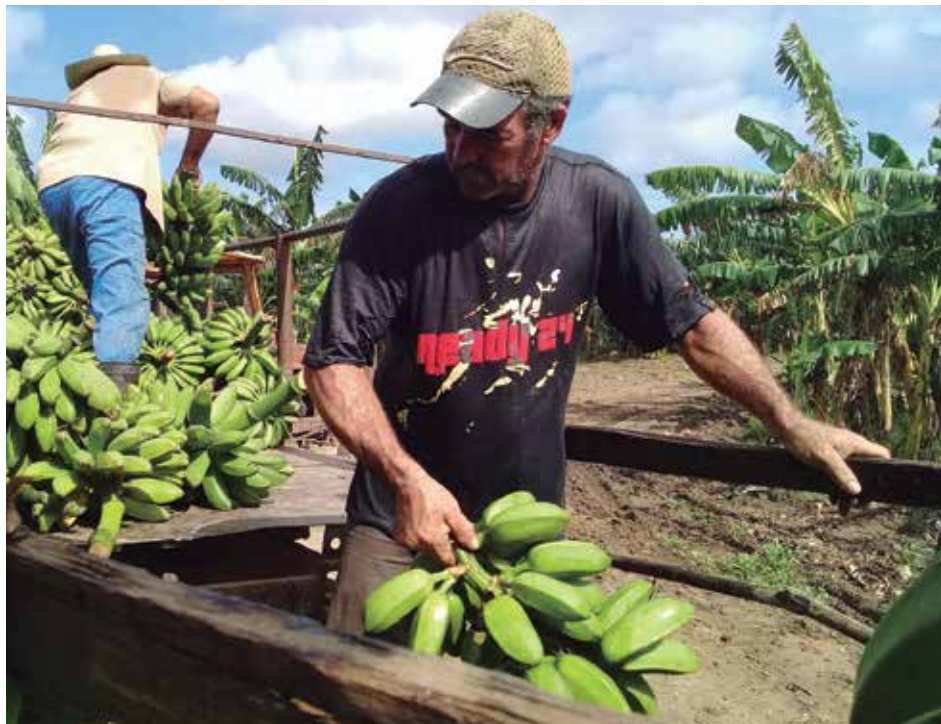
Además de enviar alimentos a Sancti Spíritus, la granja abastece los poblados de La Yaya, Palma, San Andrés y La Junta.

Luego de vivir tiempos de improductividad, en la Granja Estatal San Andrés baten aires a favor de la transformación agrícola y laboral