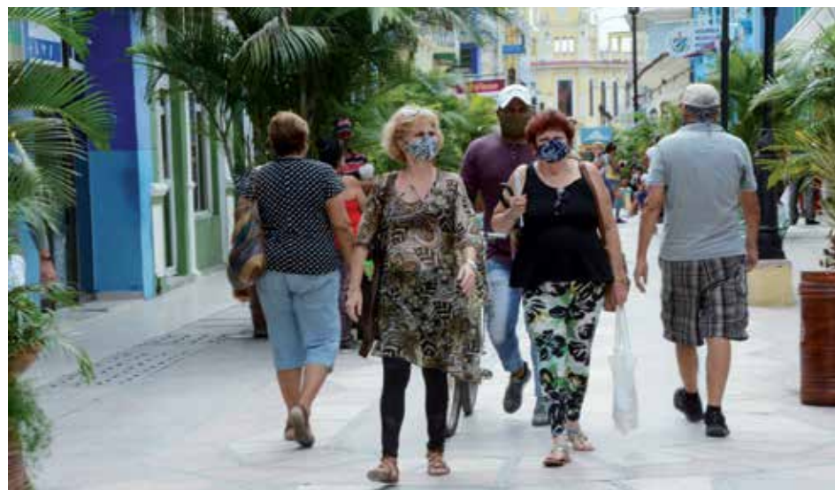
A pesar de las medidas de contención, la capital provincial muestra la situación más compleja.