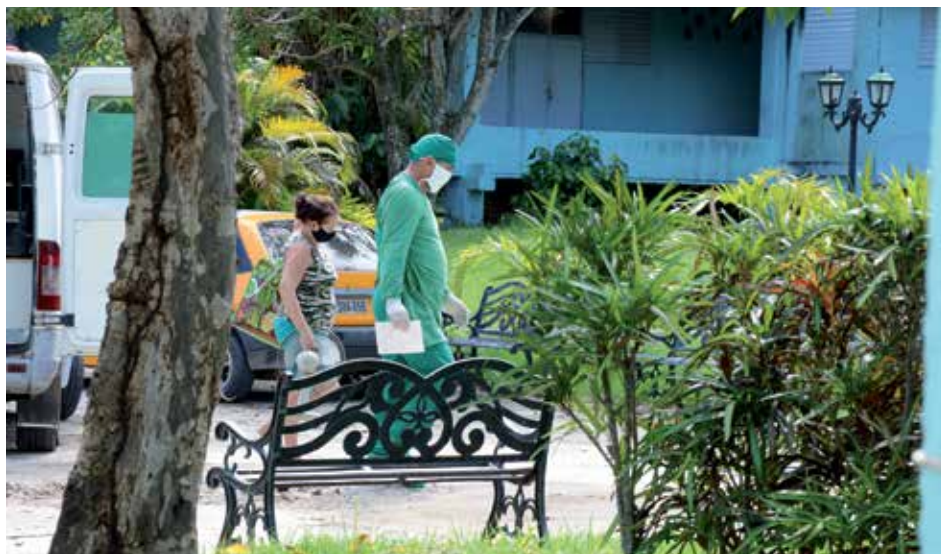
Varios espirituanos permanecen aislados en los centros destinados a este fin.