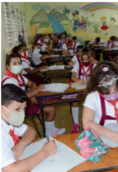
El Consejo de Defensa Provincial informará la fecha de inicio del curso.

La situación epidemiológica de la provincia pone en pausa el inicio del período lectivo