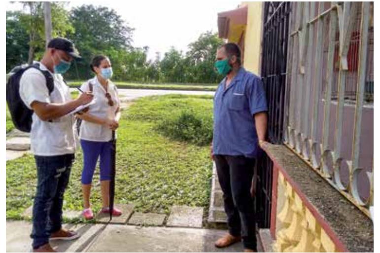
Las acciones de pesquiasje hacen el día a día de esta pareja de fisioterapeutas.

En resumen, somos nosotros, de forma individual, quienes, al estilo de los semáforos, sacamos la luz que se hará valer a la hora de que el agente patógeno se instale o no: verde, si no somos responsables y lo dejamos pasar; roja, si con nuestro actuar inteligente le ponemos un PARE.