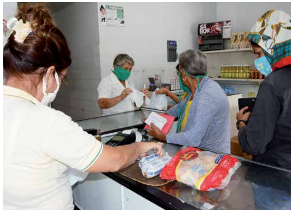
Los productos básicos seguirán ofertándose en CUC y luego en moneda nacional.

Cuando llegue el tan mencionado día cero, solo algunas unidades (al menos una en cada municipio) se encargarán de continuar recibiendo el CUC o chavito que quede en manos de la población por el tiempo que