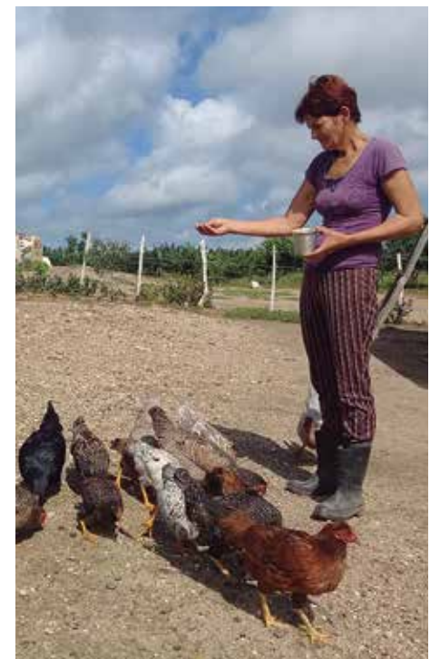
La creación de los módulos pecuarios resulta otro frente de trabajo que cobra vitalidad en la granja.

“Conozco ya más de agregados y motores que del fogón de la casa; fíjate que por el ruido del tractor le digo al operador: ‘Oye, tienes un fallo, está sonando la caja...; se han desocupado plazas, pero ya no dejo la maquinaria, aunque muchas veces tenga que ponerme a dar llaves junto a ellos o meter las manos en un tanque de grasa”.