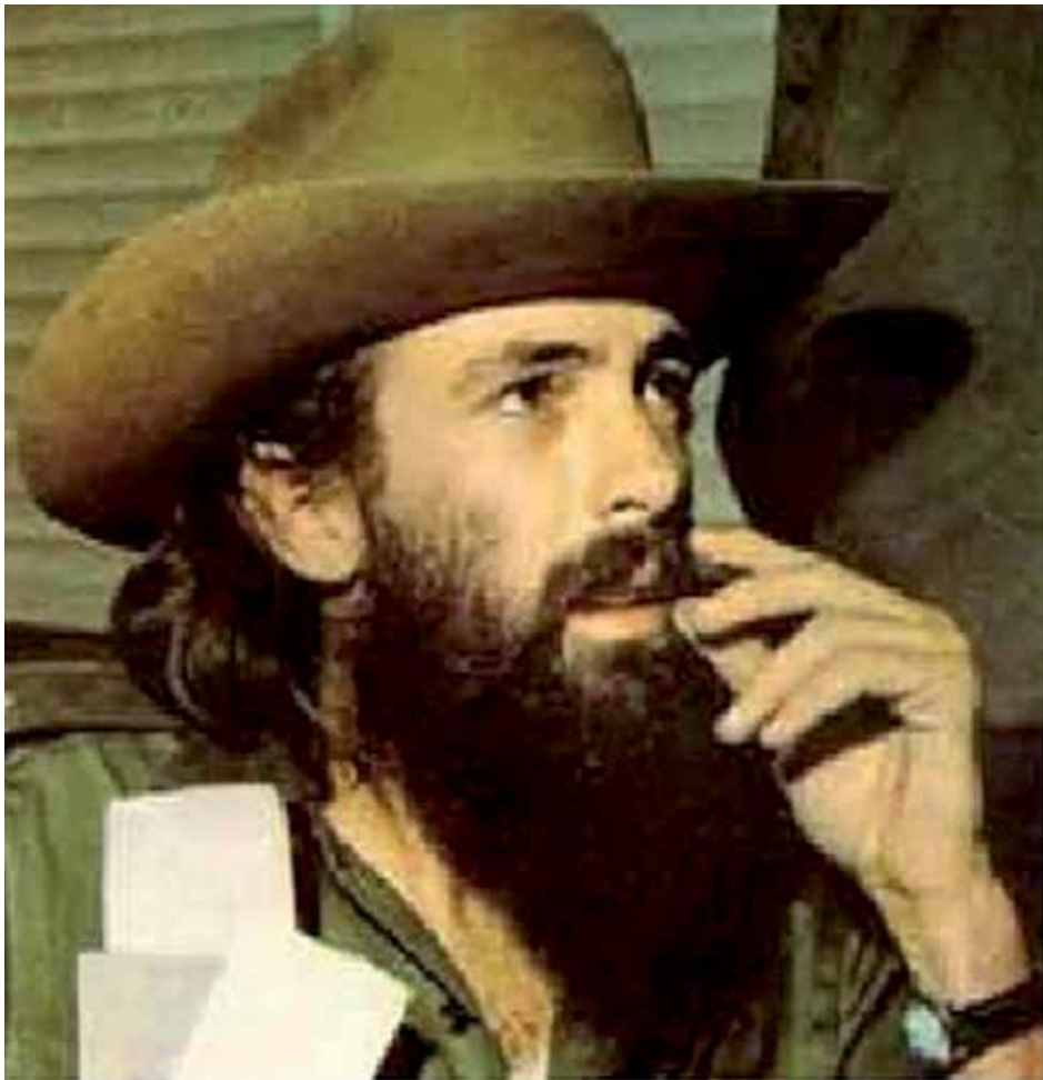
Para los cubanos Camilo es la imagen del pueblo.