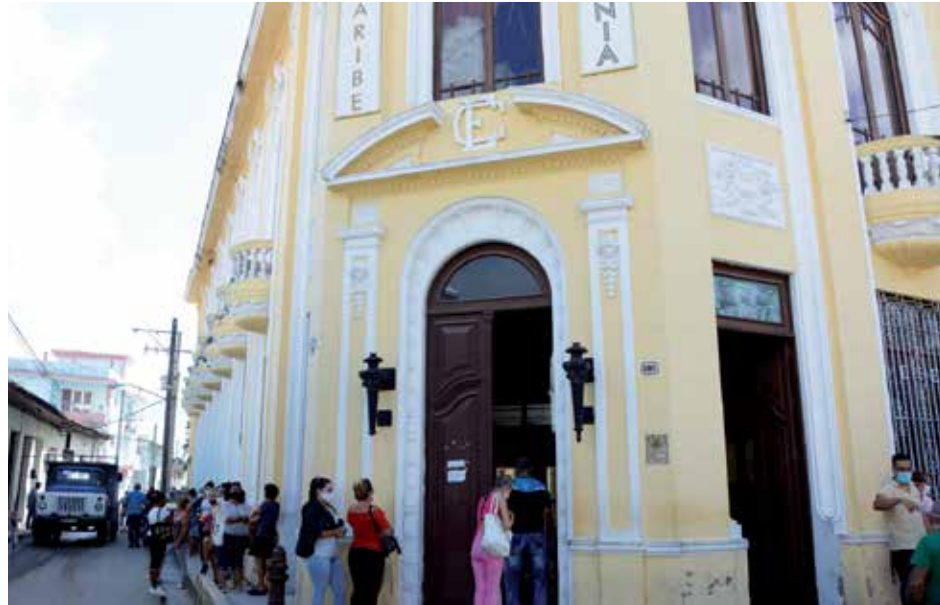
La tienda La Colonia, de la ciudad de Sancti Spiritus, integra la red de unidades comerciales de Cuba que expenden en MLC.

Pese a lo descrito, la Revolución ha conservado en toda su luz el aura humana, y cuando los vientos se echaron sobre esa torre, "como para derribar a la que los desafia", en la perspectiva de José Martí, el Gobierno aprobó, en julio pasado, la estra-