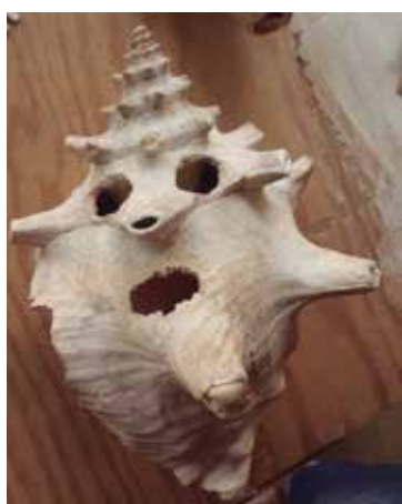
El molusco tuvo varios usos entre los aborígenes de la región.

La mascarilla semeja una cara humana y está asociada a creencias religiosas de los antepasados