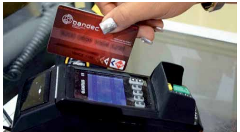
El pago en las tiendas que operan en MLC se realiza a través de tarjetas magnéticas.

Con tal precedente, veamos la dolarización parcial de la economía cubana, también, como los sacrificios a los que recurren los grandes ajedrecistas para, a la postre, ganar la partida y dejar al contrincante con la torre en la mano.