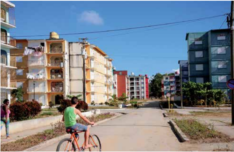
Ahora la tarifa notarial está en dependencia del precio de transferencia del inmueble que acuerden las partes del contrato.