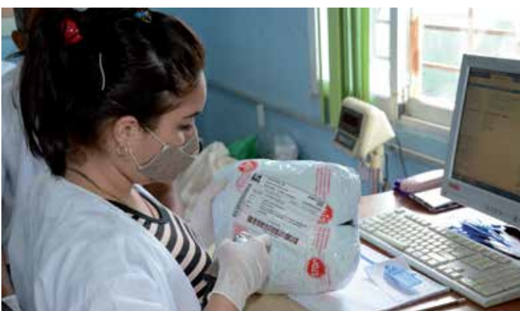
La clasificación de cada valija resulta esencial para que el envío llegue al destino indicado.

Directivo de la Empresa de Correos asegura que en marzo se implantó récord en el arribo de valijas al territorio. El Centro de Clasificación labora intensamente para agilizar las entregas