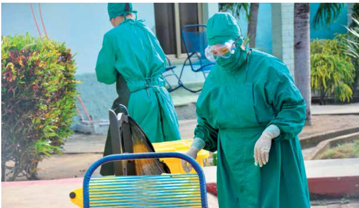
En numerosos centros de la provincia se garantiza la atención a enfermos, sospechosos y contactos.