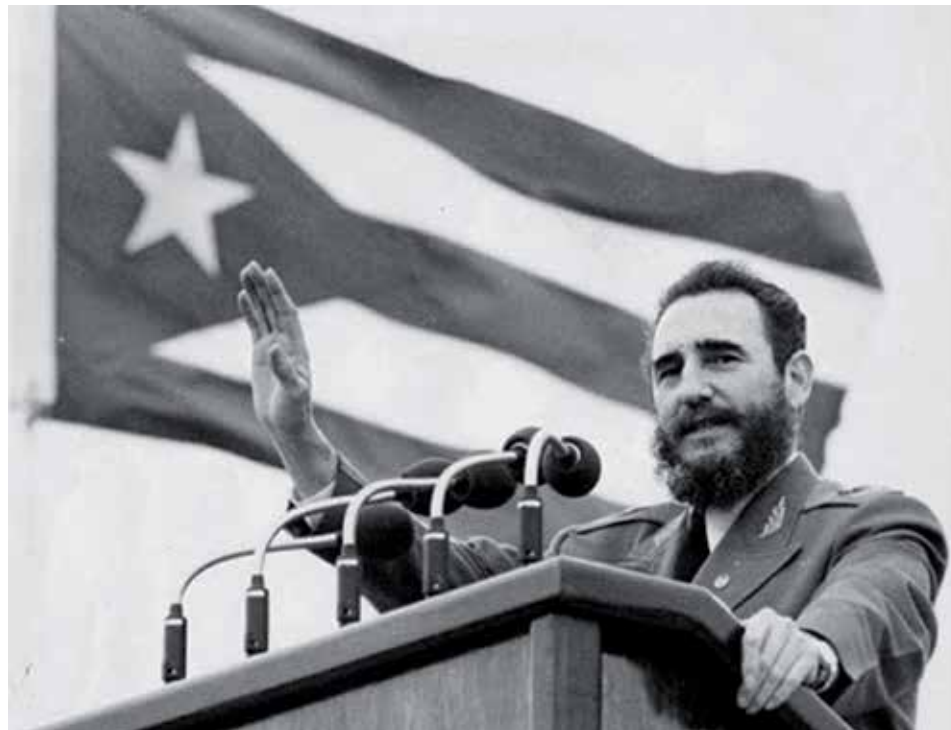
Fidel siempre estuvo al tanto hasta de los más mínimos detalles relacionados con el Partido, de sus funciones y su papel en la sociedad.

Esa solidez y visión superior del Partido, asentadas en más de siglo y medio de luchas, se ha manifestado en logros increíbles, como el apoyo multifacético a Vietnam en su combate a muerte contra la agresión de Estados Unidos (1964-1975); las campañas internacionalistas en el sur de África y en Etiopía (1975-1991), y el enfrentamiento exitoso a las calamidades aparejadas al derrumbe de la URSS y el campo socialista europeo en la década de los años 90 del pasado siglo,