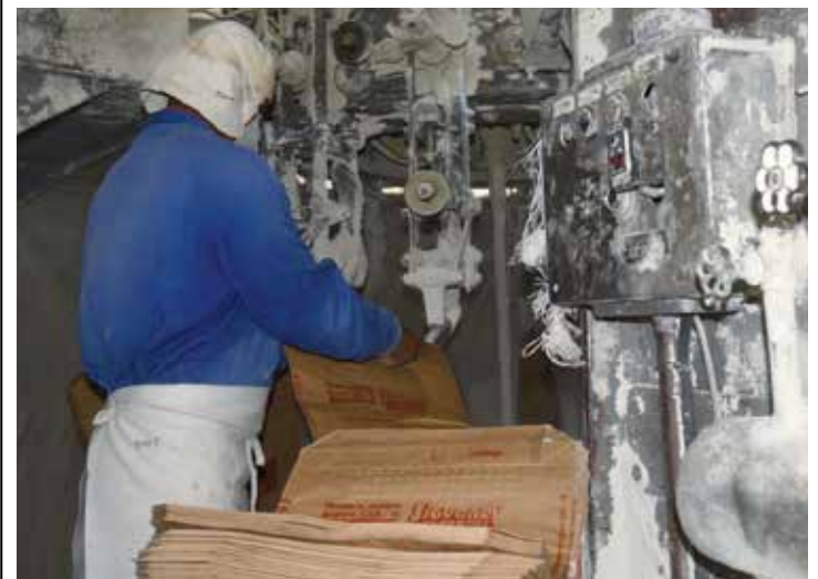
En la industria espirituanera existe un proyecto para la fabricación de cementos alternativos.

De igual modo, insistió en que va a ser un año difícil agravado por la pandemia, la situación económica del país y el significativo desabastecimiento de insumos para dar mantenimiento a la industria como electrodos, lubricantes y rodamientos, que a largo plazo se van a sentir, pero se buscan soluciones para sortear esos inconvenientes y evitar largas paradas.