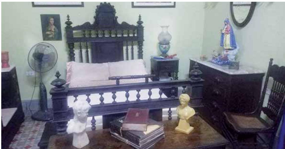
La casa de Independencia 207 norte se conserva con su estructura original.