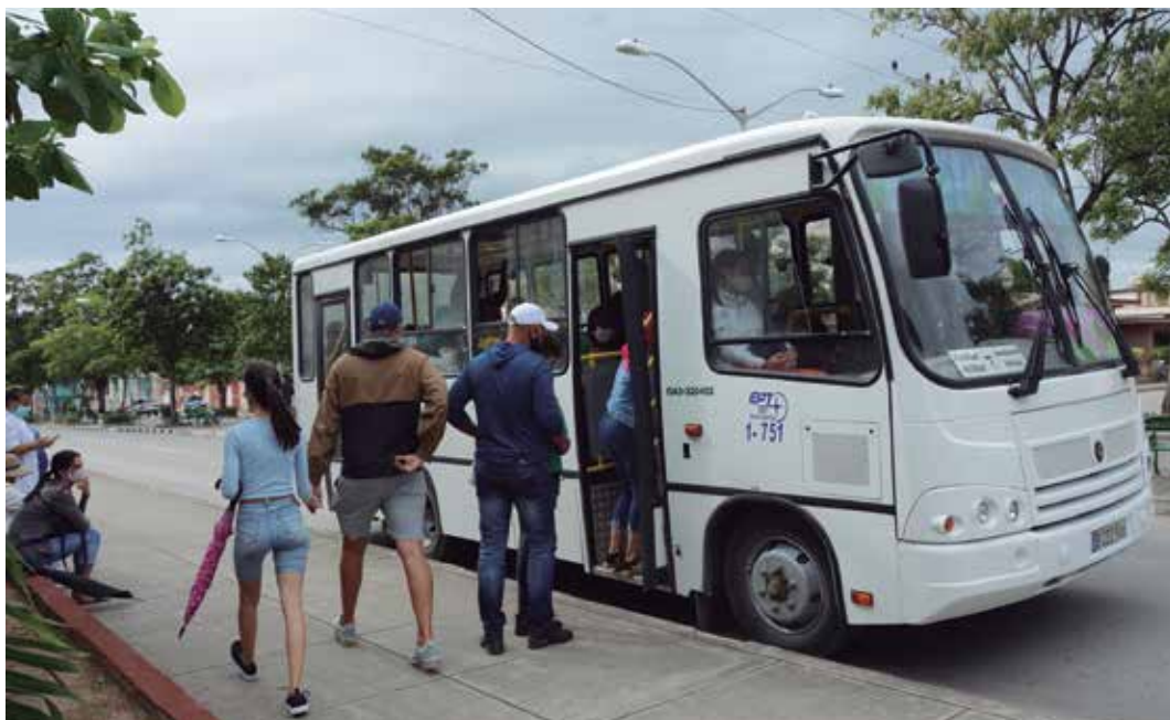
Entre las entidades con situación económica más desfavorable se encuentra la Empresa de Transporte.