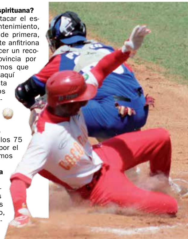
La final de la serie mostró gran rivalidad y entrega de los jugadores en el terreno.

petitivo, la base serían los muchachos que sudaron aquí, alrededor de 20 peloteros serían de los que compitieron en la serie y buscaríamos algunos para suplir cosas que nos pudieran faltar, hay que estar claros de que vamos a un escenario complejo como la Florida y, si no lo logramos, será en Taipei de China, pero hay que ir como siempre lo ha hecho el deporte cubano: a buscar un resultado. Después, cuando estén las Olimpiadas, en agosto, y el pueblo vea que hay seis equipos, incluso Israel, y que no está Cuba, es más complejo explicarlo. Podemos hacer muchas cosas en el orden organizativo, el pueblo puede estar contento, pero mientras no logremos resultados seguiremos con esa gran deuda con nuestro pueblo. El compromiso es que con este mismo entusiasmo, alegría y entrega mostrada en la Serie Nacional podamos alcanzar ese propósito.