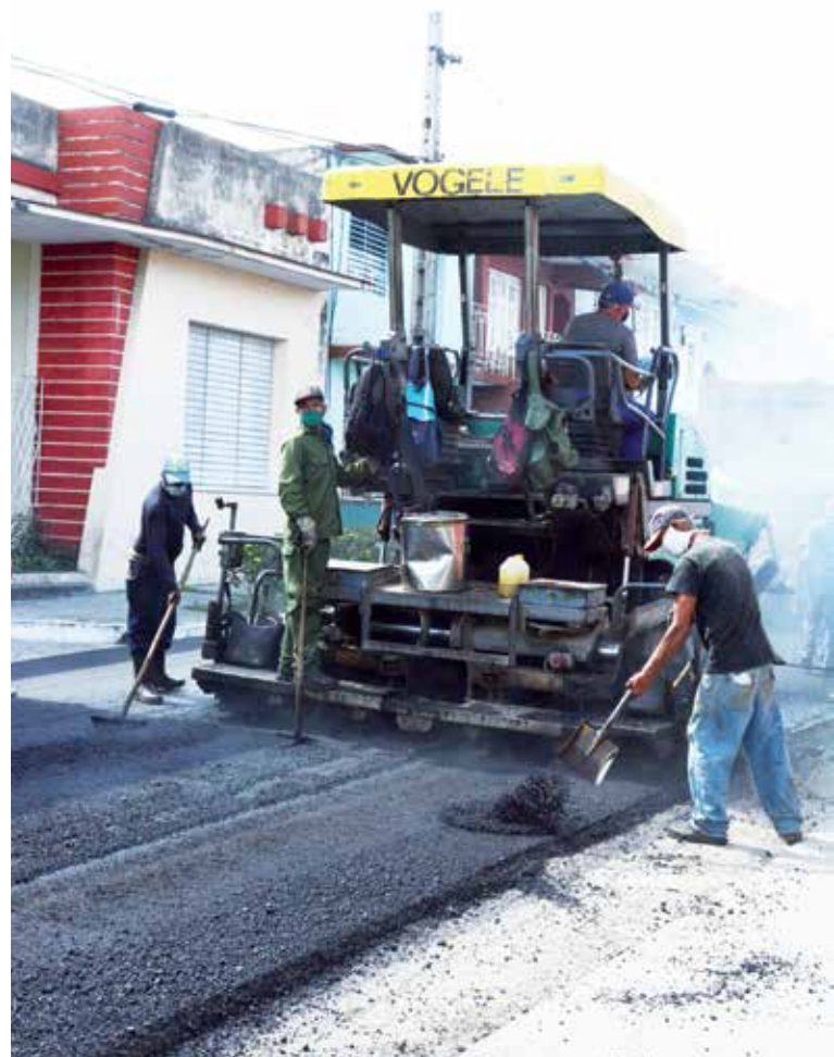
Algo más de 7 000 toneladas de asfalto se verterán en la provincia para mejorar las vías.