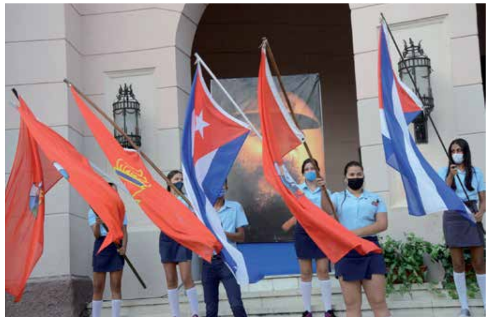
Los jóvenes espirituanos son verdaderos protagonistas de las batallas de estos tiempos.

La administración del producto se realiza por vía intramuscular en el deltoides y hasta el momento a los vacunados solo les ha provocado reacciones locales en el sitio de la inyección.