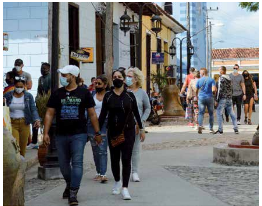
Urge reducir la movilidad en la capital provincial y en todos los territorios.

Las multas duplican su cuantía una vez transcurridos los primeros 30 días después de la imposición. Si durante ese período no se formaliza el pago, se radica una denuncia legal contra el multado ante la unidad de la Policía Nacional Revolucionaria correspondiente.